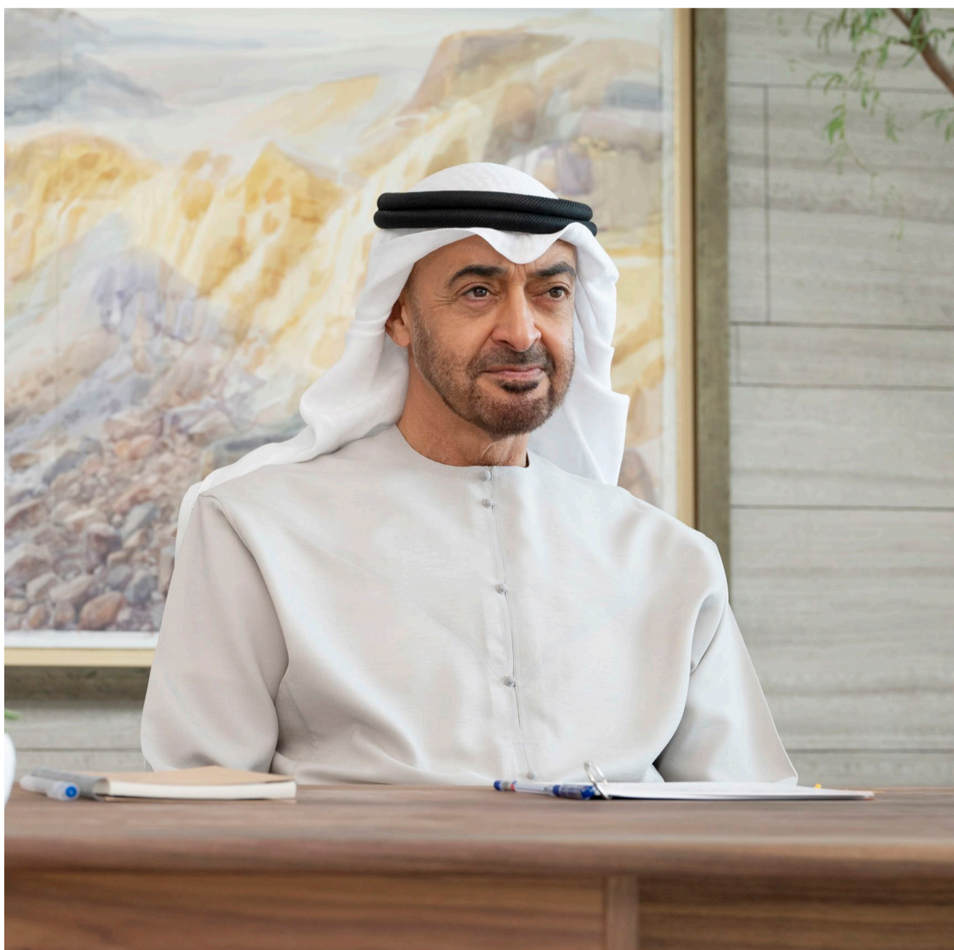
محمد بن زايد خلال مشاركته في قمة قادة مجموعة «١٢U٢»

كما شارك في القمة فخامة جو بايدن رئيس الولايات المتحدة الأمريكية ومعالي ناريندرا مودي رئيس وزراء جمهورية الهند ومعالي يائير لابيد رئيس وزراء إسرائيل. ص «٤+٢+٢»