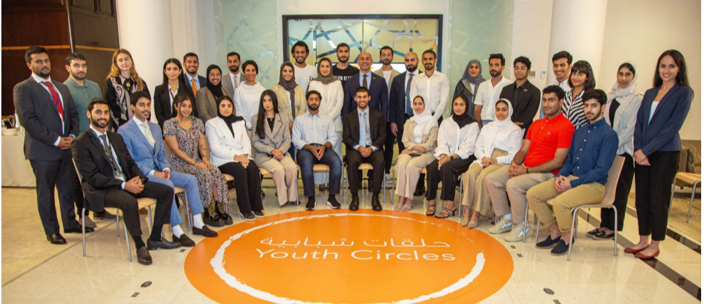
جانب من المشاركين في الورشة