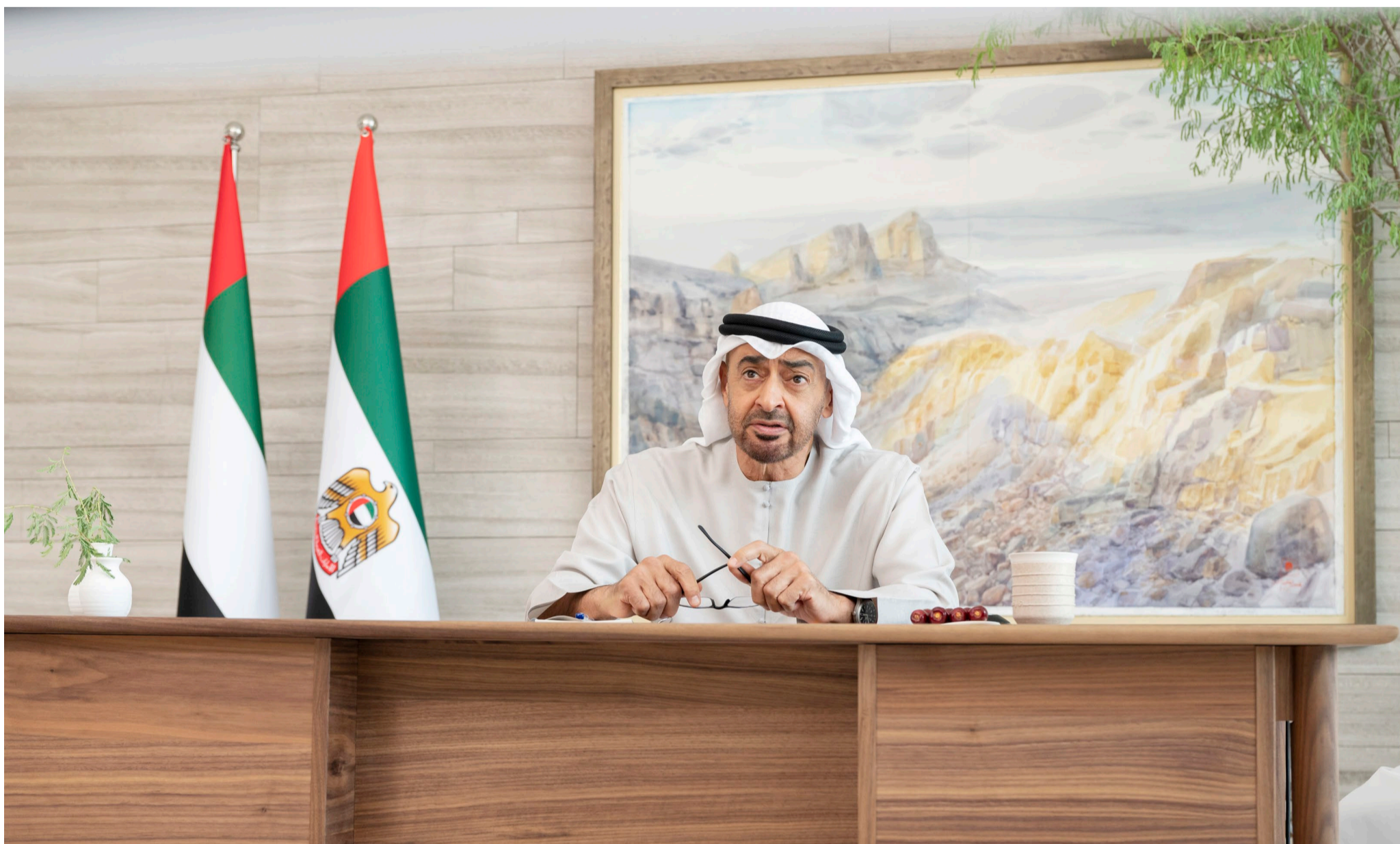
محمد بن زايد خلال مشاركته عن بعد في قمة قادة مجموعة «١٢٧»

■ سموه: الإمارات تواصل نهجها الراسخ بدعم كل خطوة تعزز التعايش والتعاون بين الدول