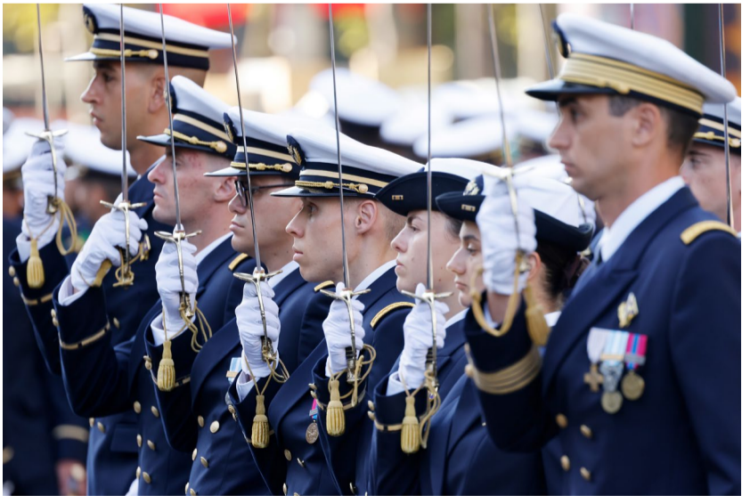
أ ف ب