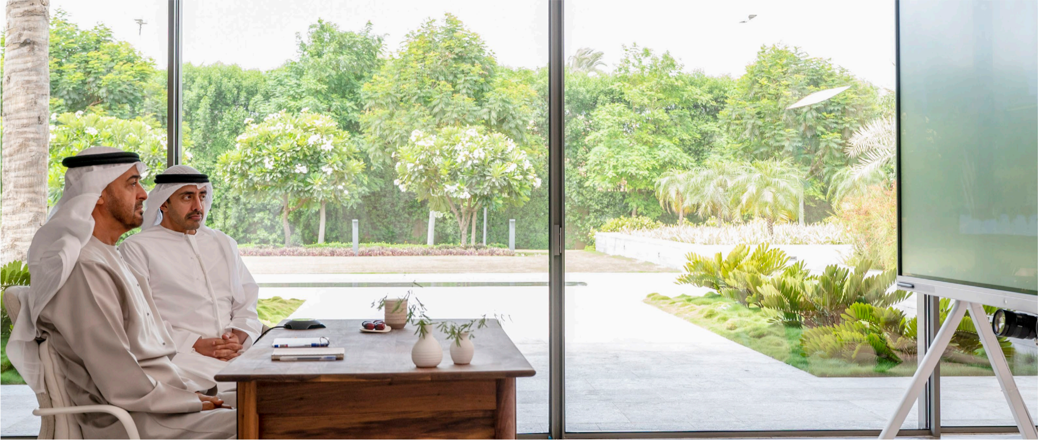
محمد بن زايد خلال مشاركته عن بعد في قمة قادة مجموعة «ا٢٠٢» بحضور عبدالله بن زايد