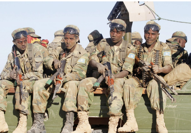
جانب من الجيش الصومالي

أعلن الجيش الصومالي، مقتل ٢٥ من عناصر «حركة الشباب» الإرهابية، خلال عملية في إقليم هيران وسط البلاد، بينما أنهى الرئيس الصومالي حسن شيخ محمود، زيارة إلى إريتريا بتوقيع عدة اتفاقيات وتفقّد وحدات من القوات البرحية الصومالية المتدربة هناك.