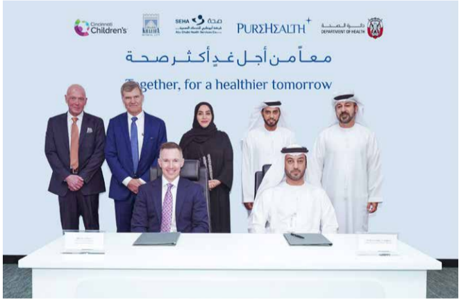
ظلال توقيع عقد الشراكة

أعلنت "بيورهيلث"، وشركة أوبوتي للصحة - "صحة"، إنشاء مركز تميز لطب الأطفال بالتعاون مع "مستشفى سينسيناتي للأطفال"، المركز المرموق عالمياً والأعلى تصنيفاً في الولايات المتحدة ضمن مجال رعاية الأطفال.