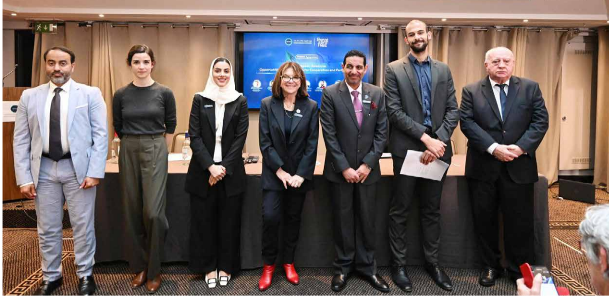
جانب من المشاركين في الندوة

جاء ذلك في ندوة دولية نظمها مركز تريندز للبحوث والاستشارات ضمن المحطة الفرنسية من جولته البحثية الأوروبية وفي ختام مشاركته بمعرض باريس الدولي للكتاب، حول "العلاقات الخليجية الأوروبية: فرص وأفاق للتعاون والشراكة"، في فندق نابليون بالعاصمة باريس بحضور ومشاركة عدد من كبار الشخصيات الفرنسية والعربية، وحشد كبير من الإعلاميين، وناقشت مختلف جوانب العلاقات بين فرنسا ودول الخليج العربية، بما في ذلك التعاون السياسي والاقتصادي والثقافي. وشددت الندوة على أهمية العلاقات الخليجية الفرنسية، وضرورة تعزيزها وتطويرها في مختلف المجالات. وأوصت بتعزيز التعاون الاقتصادي والتجاري، ودعم تبادل المعرفة والخبرات في مجال الذكاء الاصطناعي والتكنولوجيا المتقدمة، وتعزيز الحوار الثقافي بين الحضارتين العربية والأوروبية، وتعزيز العلاقات الخليجية الأوروبية كنموذج للشراكات العالمية الفعالة. وأوضحوا أن هذه الندوة الدولية خطوة مهمة في سبيل تعزيز العلاقات، وتحديد آفاق التعاون المستقبلي في مختلف المجالات.