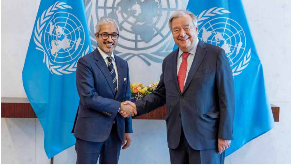
أنطونيو غوتيرش خلال استقباله محمد أبوشهاب

المتحدة على تعزيز التسامح والتعايش السلمي، وبناء مجتمعات سلمية، وتمكين النساء والفتيات حول العالم، وتوظيف الذكاء الاصطناعي والتكنولوجيا لتحقيق التنمية المستدامة، ومواصلة تولي دور قيادي في العمل المناخي". يذكر أن سعادة السفير محمد أبوشهاب، قد شغل منصب نائب المندوب الدائم لدولة الإمارات لدى الأمم المتحدة منذ أغسطس ٢٠٢١. وكان سعادته قبل ذلك قد تولى منصب سفير الدولة لدى مملكة بلجيكا، والاتحاد الأوروبي، ودوقية لوكسمبرغ. وتولى سعادته عدة مناصب مهمة في وزارة الخارجية، منها مدير إدارة تخطيط السياسات، ومدير إدارة الشؤون الأمريكية والمحيط الهادئ. كما يمتلك سجلاً حافلاً من العمل في مجال المناخ، والانتقال إلى الطاقة النظيفة، حيث تولى إدارة القسم الدولي للتغير المناخي في إدارة شؤون الطاقة والتغير المناخي، وشغل ذلك ترؤسه عدة وفود لدولة الإمارات في مفاوضات اتفاقية الأمم المتحدة الإطارية لتغير المناخ، والإشراف على مشاركة الدولة في الاجتماع الوزاري للطاقة النظيفة، وتمثيل الدولة في فريق عمل الطاقة النظيفة وكفاءة الطاقة لمجموعة العشرين. وام