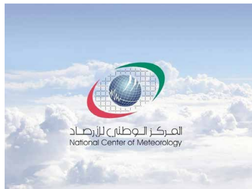
المركز الوطني للأرصاد National Center of Meteorology

قال المركز الوطني للأرصاد إن البلاد ستشهد حتى بعد ظهر اليوم الأربعاء، سحباً ركامية على المناطق الساحلية تحرك باتجاه المناطق الشرقية والشمالية، يصاحبها سقوط أمطار مختلفة الغزارة مع البرق والرعد مع احتمال سقوط البرد على بعض المناطق.