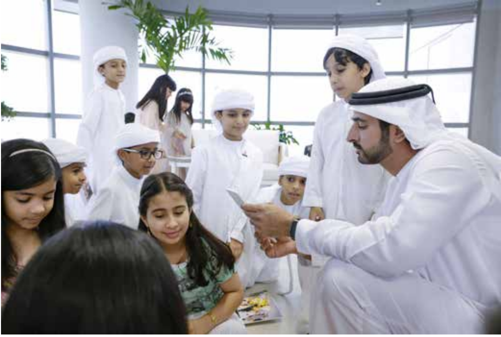
حمدان بن محمد ظل لفانه مجموعة من الأطفال المواطنين المشاركين في تنظيف مرجان دبي عقب الحالة الجوية الاستثنائية