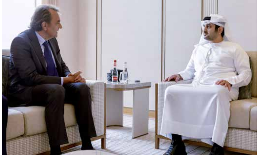
مكتوم بن محمد ظل لفانه رولي رابارد

العديدة التي تتمتع بها في هذا المجال والحرص على إيجاد أطر قانونية وتنظيمية مهم للأعمال على مستوى العالم، بما في ذلك البنية الأساسية القوية التي تضعها في متناول شركائها دعماً لما يطمحون إليه من فرص النمو والتطور، علاوة على النهج الواضح الذي يتبعه في سنّ السياسات ووضع الأطر التنظيمية المرنة والتي تحرص أن تكون داعمة لمصالح شركائها من مؤسسات الأعمال العالمية على تنوع أحجامها وتخصصاتها. كما تناول النقاش التسهيلات التي تمنحها دبي للشركات العالمية الساعية إلى دخول أسواق المنطقة وتعزيز أعمالها فيها، وكذلك المناطق المحيطة بما تضمه من أسواق ناشئة واعدة، مع الاستفادة من البيئة الاستثمارية التي أسستها دبي وراعت فيها أن تكون على قدر كبير من الديناميكية بما يتواءم مع متطلبات الشركات العالمية والاستثمارية، بما في ذلك المتخصصة في مجال إدارة الأصول.