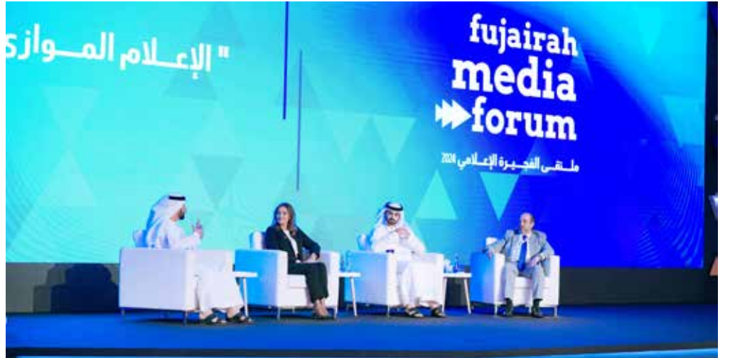
جانب من الملتقى

فيها عن تطور المشهد الإعلامي في إمارة رأس الخيمة، انطلاقاً من رؤية صاحب السمو الشيخ سعود بن صقر القاسمي، عضو المجلس الأعلى حاكم رأس الخيمة، وإيمانه بأهمية الدور الاستراتيجي للإعلام في تحقيق التنمية الشاملة والمستدامة. وتطرقت سعادتها إلى دور المكتب الإعلامي لحكومة رأس الخيمة، في صياغة الرسائل الإعلامية الرئيسية للإمارة بأدوات وأفكار مبتكرة تواكب التقدم التكنولوجي والتقني الذي يشهده القطاع الإعلامي في الدولة والعالم، فضلاً عن نجاحاته في الوصول للجمهور العالمي وتعريفه بإنجازات رأس الخيمة في مختلف القطاعات الحيوية، وتعزيز مكانتها المتنامية على المستويين الإقليمي