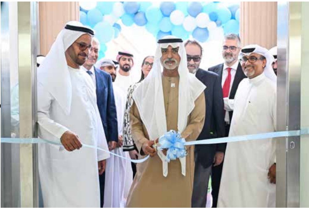
نهيان بن مبارك ظل افتتاحه المركز الطبي

ودعم المبادرات المعنية بالصحة العامة. حضر الافتتاح معالي ناصر أحمد خليفة السعودي، وعدد من الأطباء المختصين، وعدد من أهالي وسكان مدينة شخبوط، و