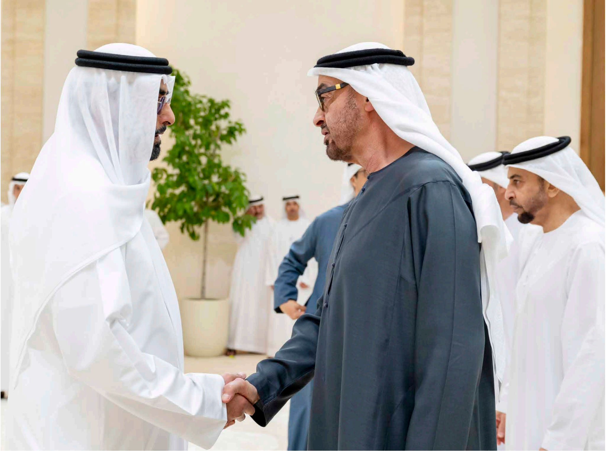
محمد بن زايد طلال تقبله النخاري بحضور حمدان بن زايد