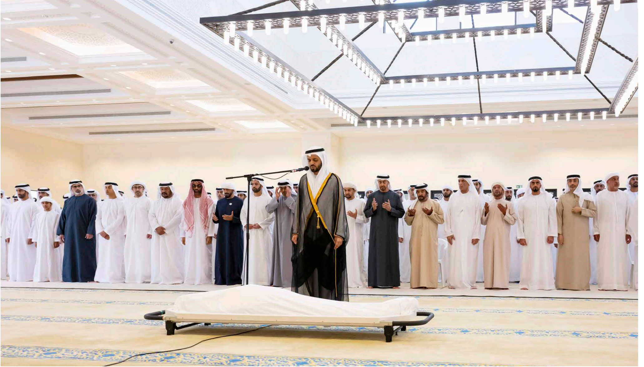
محمد بن زايد وسعود بن طغر ومطور بن زايد وخالد بن محمد بن زايد ومحمد بن سعود وهراج وطحنون وحمدان بن زايد وسيف وسرور بن محمد ونهيان وذياب وسيف وعبدالله وخالد بن زايد وسلطان بن خليفة وسعيد بن محمد والشيوخ طلال أداه الطلاء على جثمان مفيد الوطن