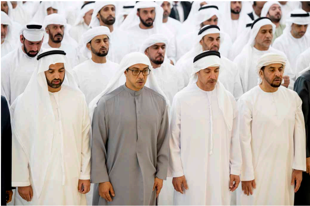
منصور بن زايد ومحمد بن سعود وهزاع وحمدان بن زايد