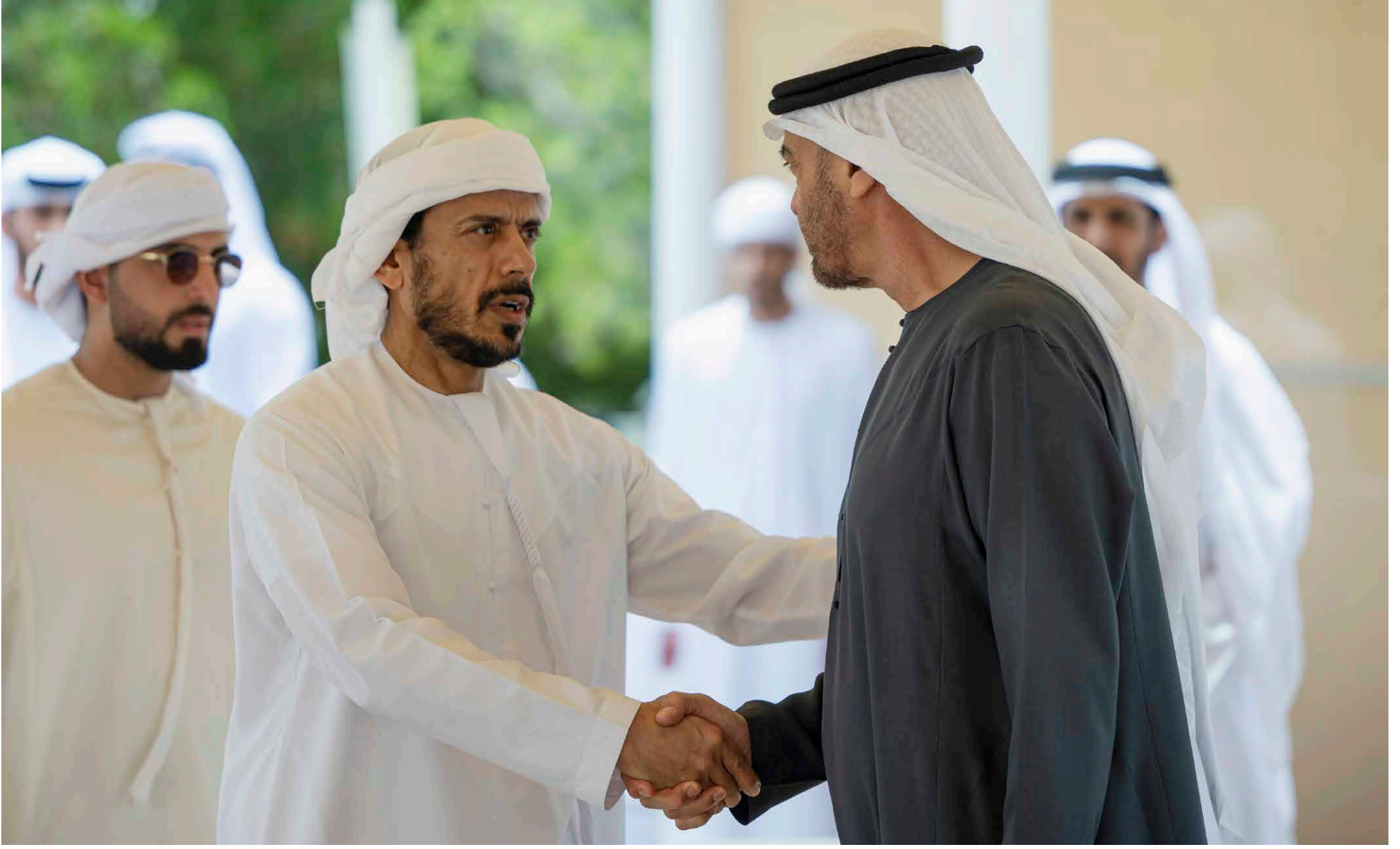
محمد بن زايد بنقيل نغازي سلطان بن طنون