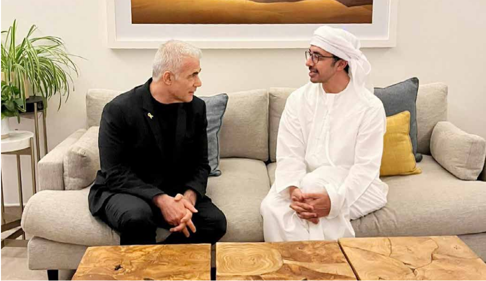
عبدالله بن زايد خلال لقائه ناصر الليد