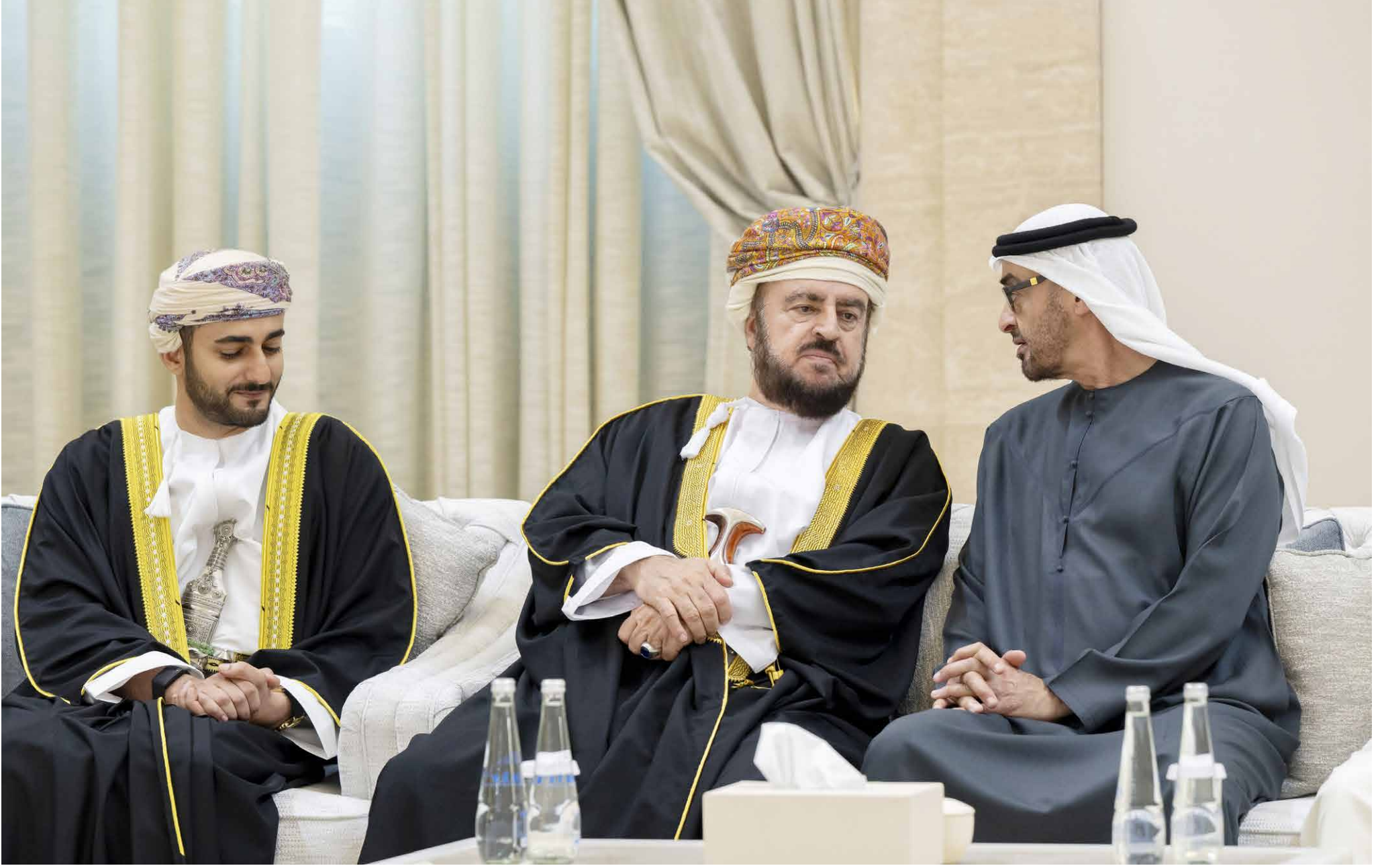
محمد بن زايد طلال نقيبته التعازي من الممثل الخاص لسلطان عمان