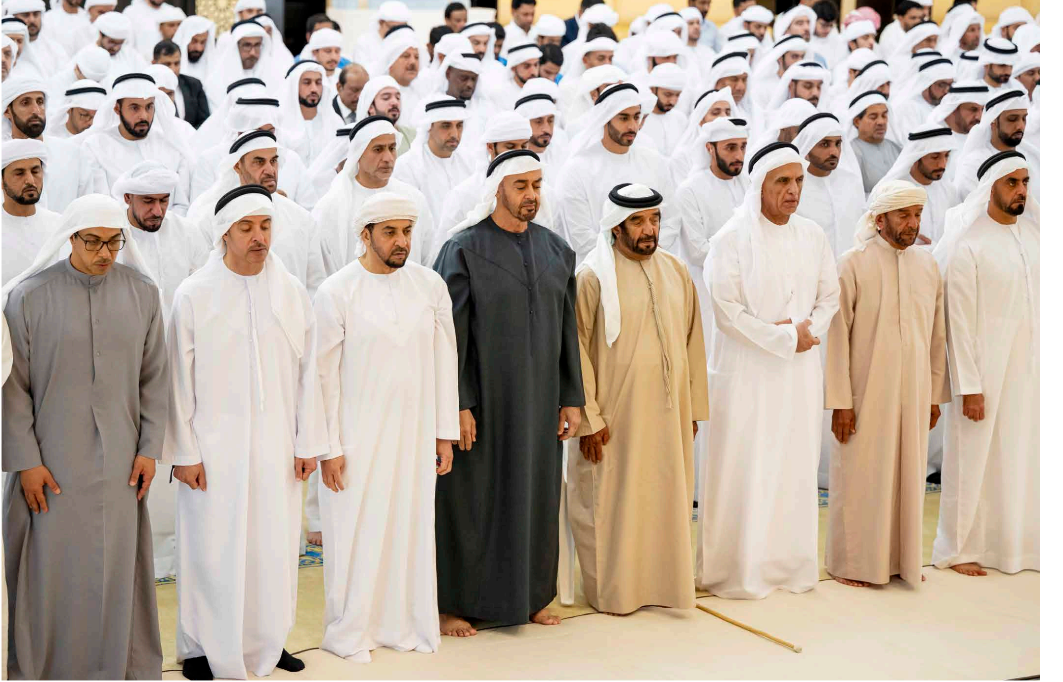
محمد بن زايد وسعود بن صفر ومنصور وهزاع وحمدان بن زايد وسيف وسرور بن محمد وسيف بن زايد والشيخ خالد أدهم الصلح على جنمان مفيد الوطن