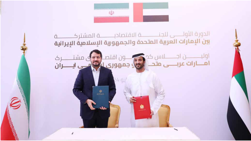
عبدالله بن طوق ومهرداد بذراش

والتي تلعب دوراً حيوياً في دعم الاستدامة للمسيرة التنموية للدولة بطول العقد المقبل. وشهد الاجتماع، مناقشة آليات جديدة لدعم زيادة المبادلات التجارية، وأهمية الدور البارز والمحوري للقطاع الخاص في تعزيز التعاون الاقتصادي، وتوفير كافة سبل الدعم للمصدرين والمستوردين لتسهيل زيادة تبادل السلع والخدمات والعمل على تنويعها، وفتح قنوات جديدة للتواصل بين مجتمع الأعمال في البلدين.