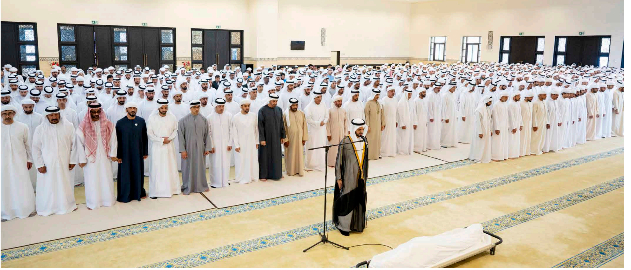
محمد بن زايد وسعود بن صقر ومنصور بن زايد ومحمد بن سعود ومهراع وطحنون وحمدان بن زايد وسيف وسرور بن محمد ونهيان وذياب وسيف وعبدالله بن زايد وسلطان بن خليفة وسعيد بن محمد وخليفة ومحمد بن سيف بن محمد والشيخوخلال أداء الصلاة على جثمان مفيد الوطن