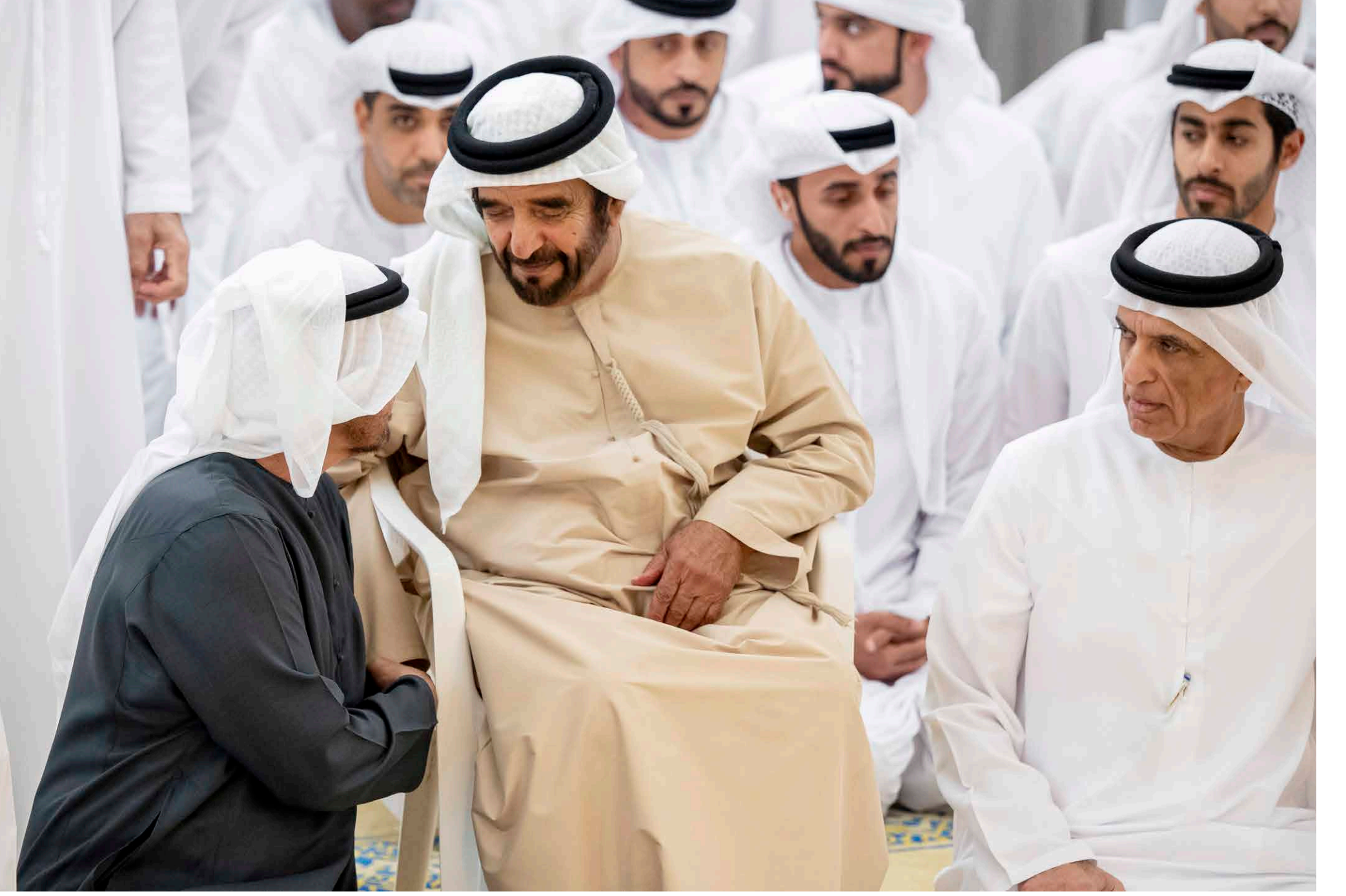
محمد بن زايد وسعود بن طغر وسيف بن محمد