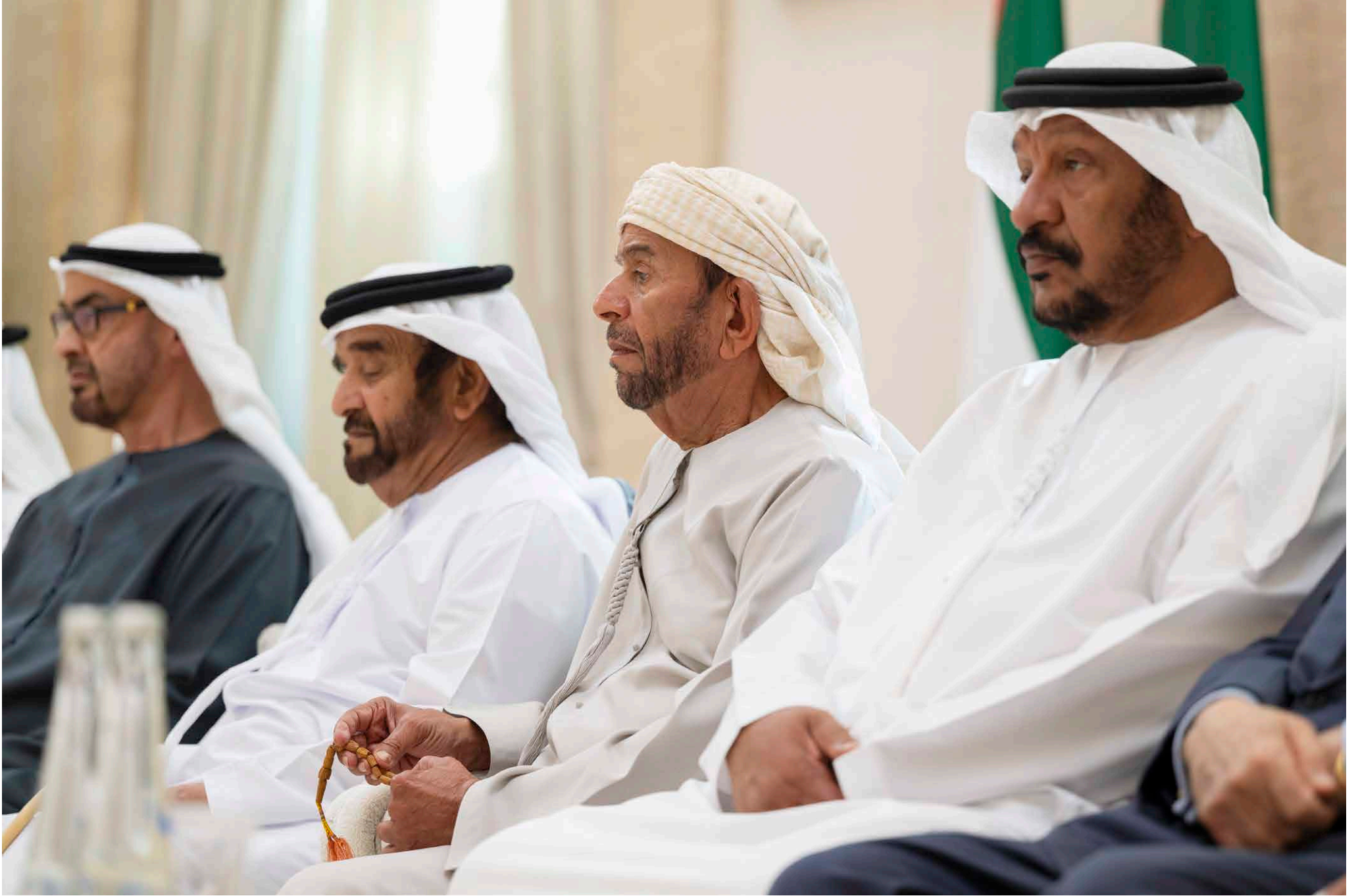
محمد بن زايد خلال تقبله التعازي بحضور سيف وسرور وسعيد بن محمد