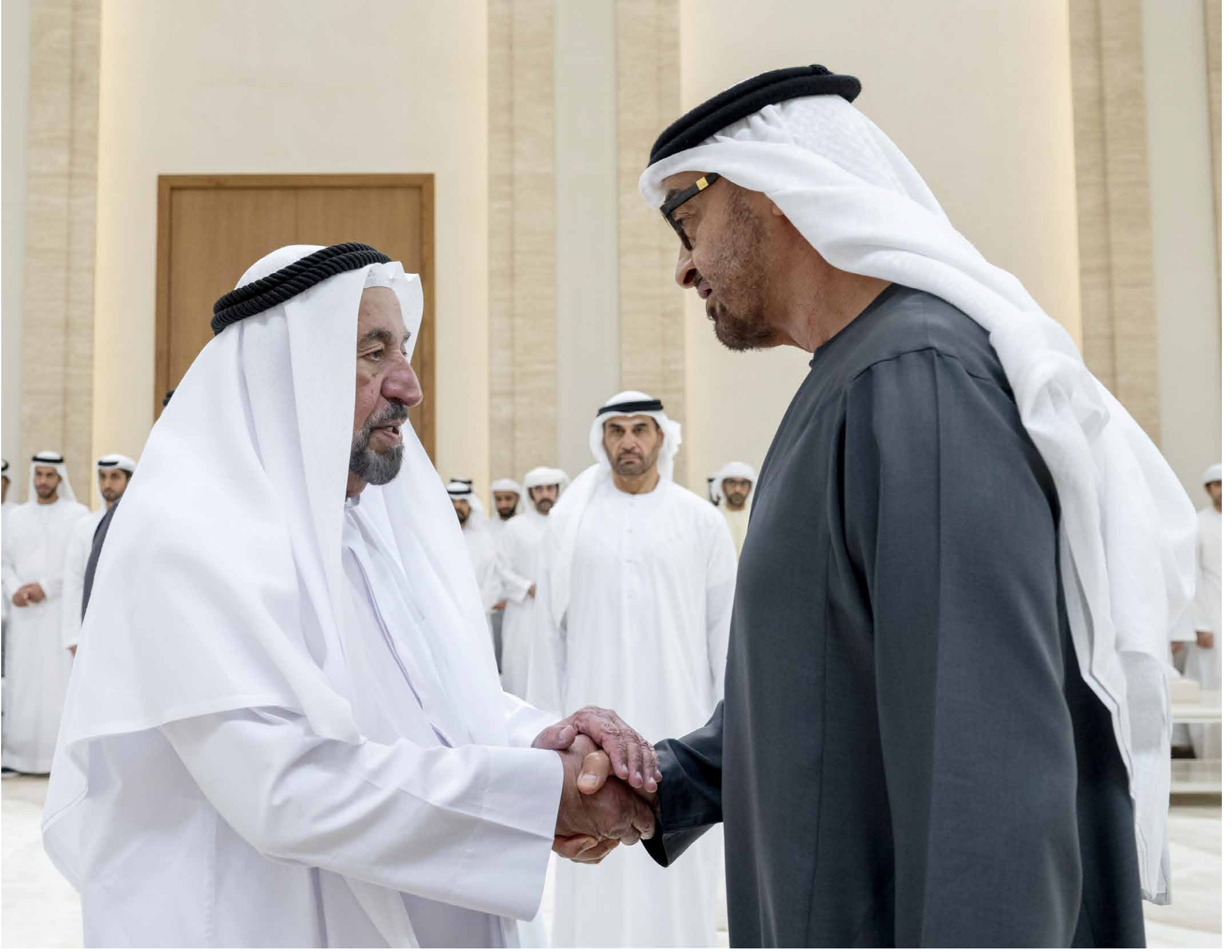
محمد بن زايد خلال تقبله تعازي سلطان الفاسمي