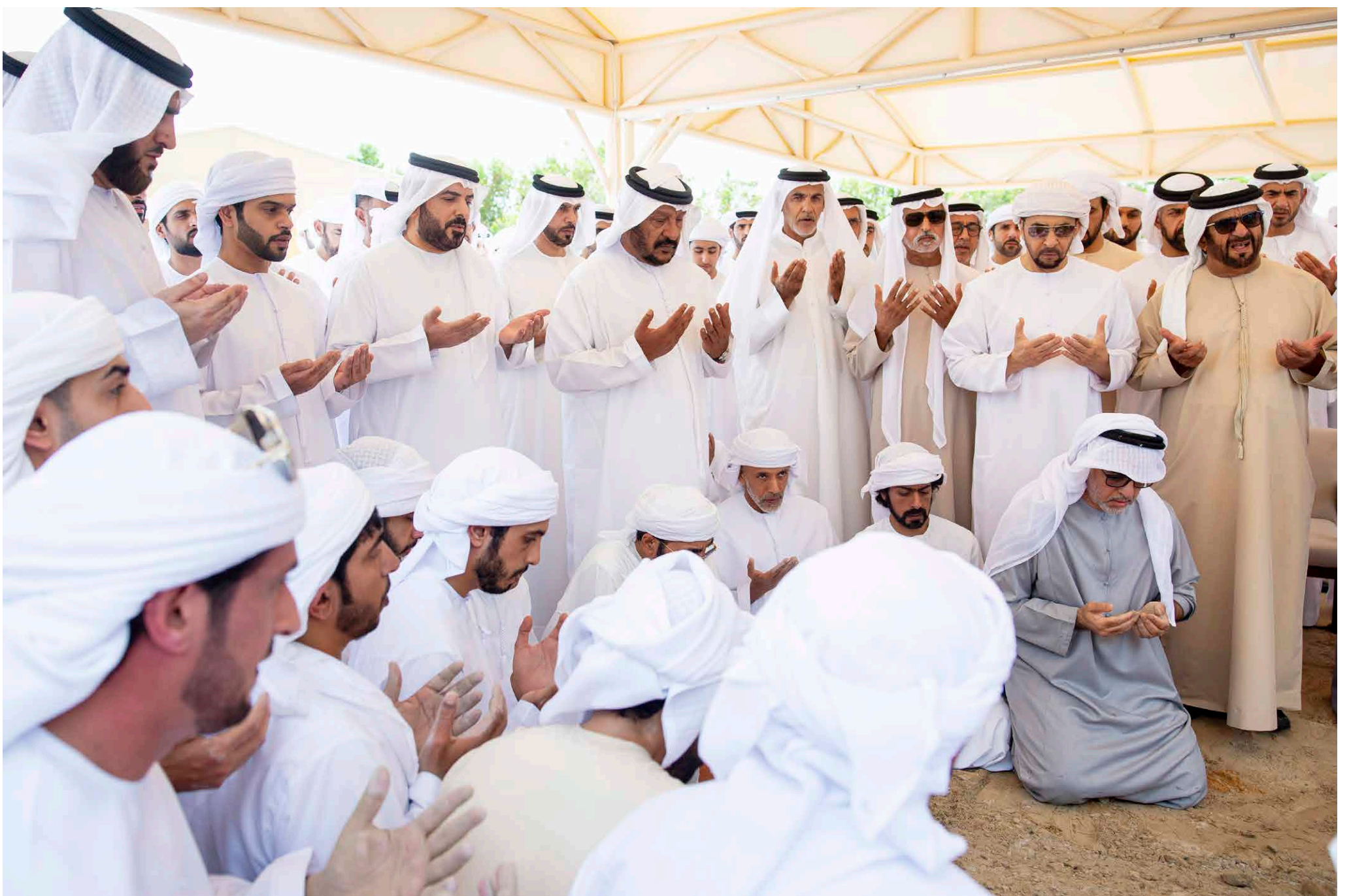
حمدان بن زايد وسيف وسعيد بن محمد ونهيان بن مبارك وخليفة ومحمد ونهيان بن سيف وخليفة بن محمد بن خالد