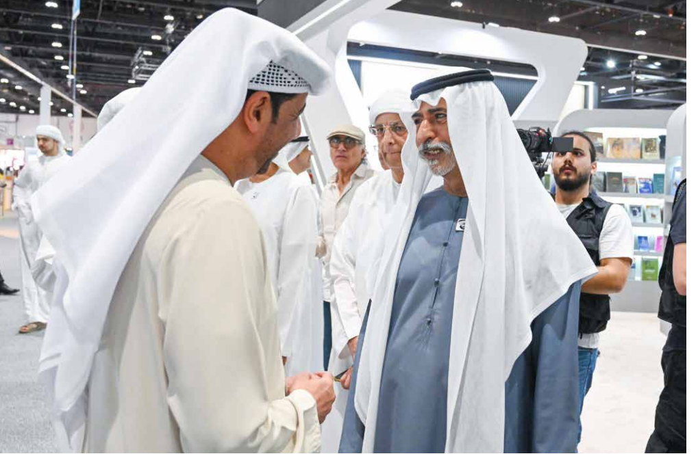
نهيان بن مبارك خلال زيارته جناح المركز في المعرض

تدشين الكتاب الـ ١٢٠ من موسوعة الإخوان بحضور رئيسي الإنترنت ومجلس الأمن السيبراني وسفير البحرين