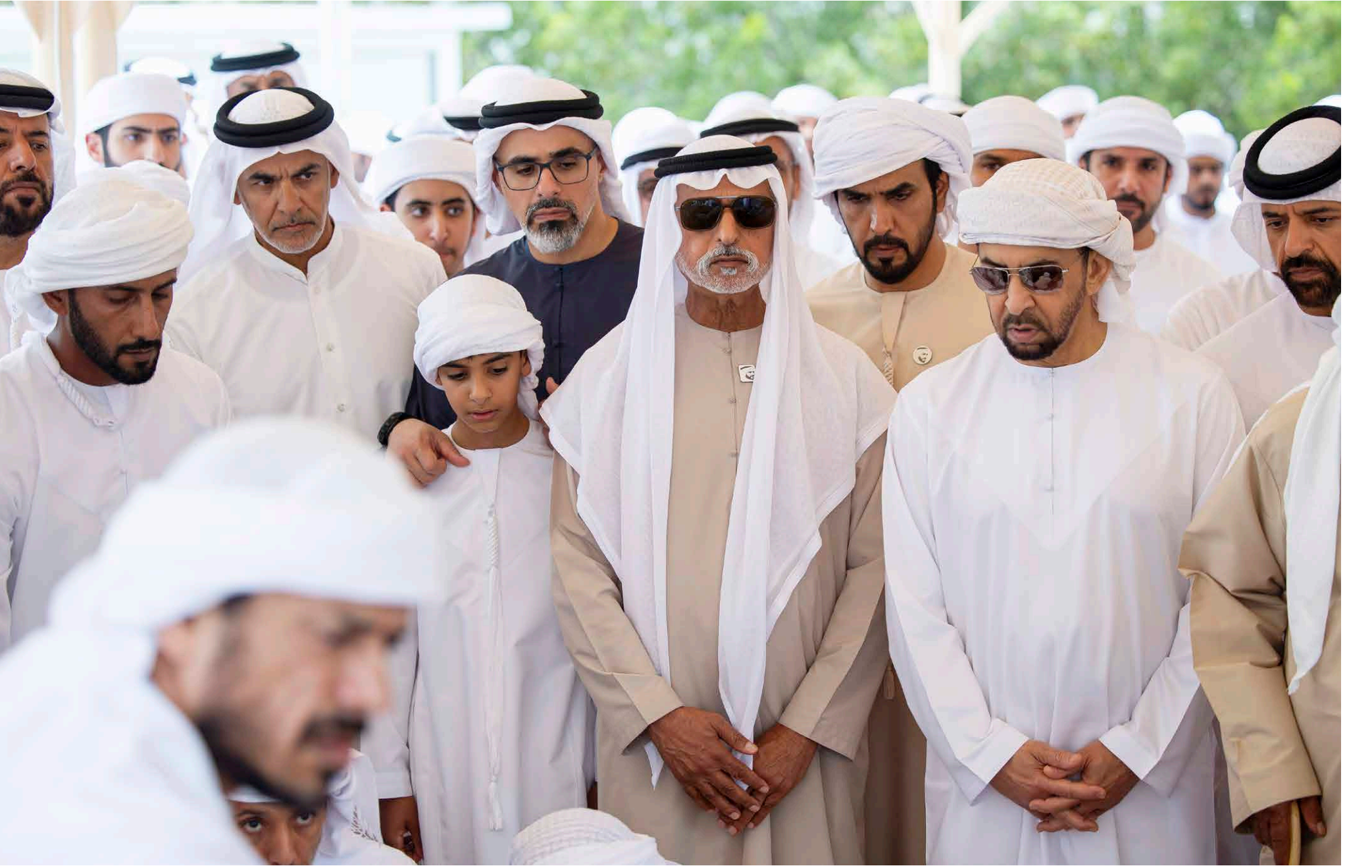
خالد بن محمد بن زايد وحمدان بن زايد وسيف بن محمد ونهيان بن مبارك وطيبة وسعيد ومحمد بن سيف