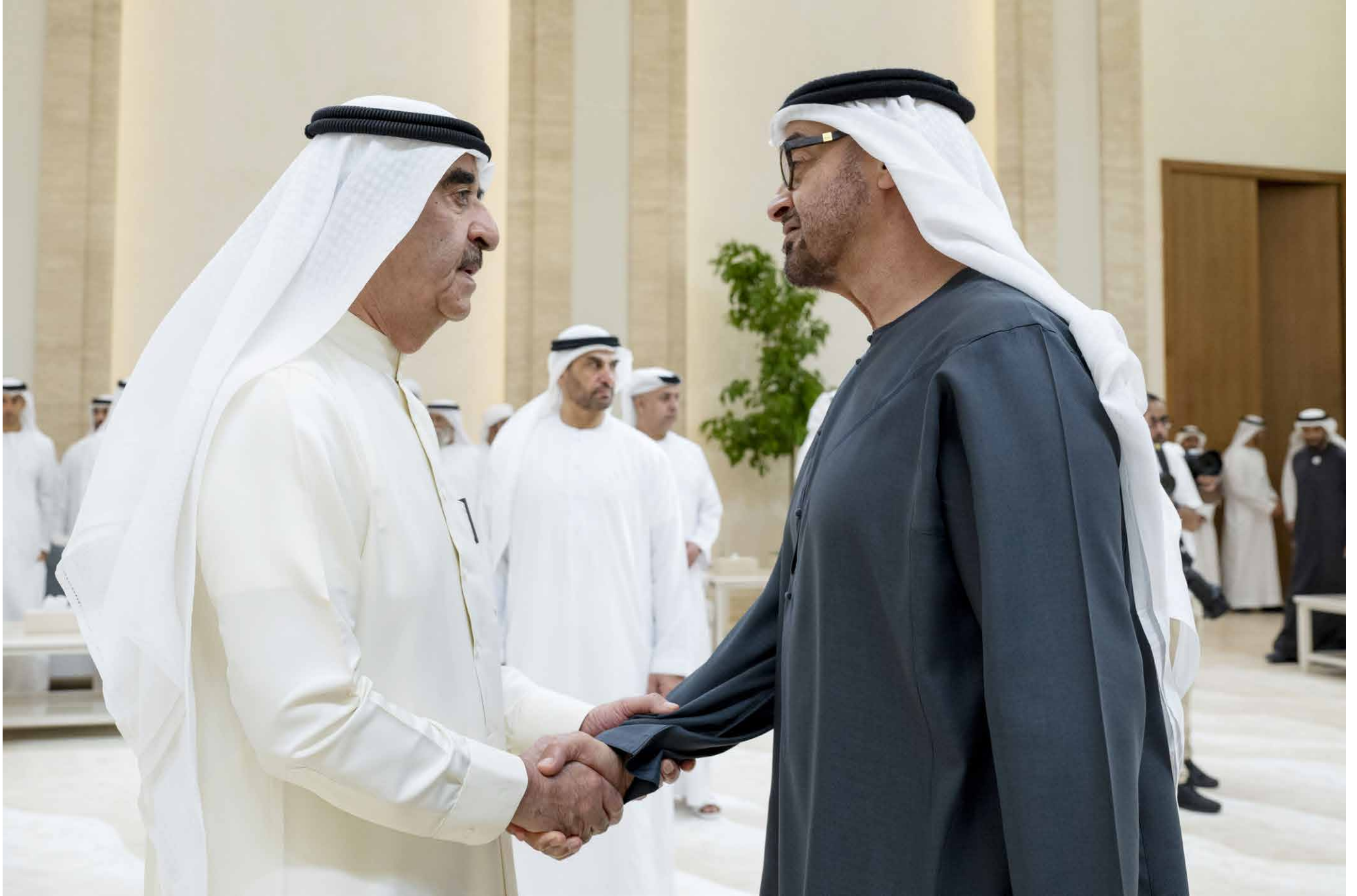
محمد بن زايد طلال تقبله نعازي سعود الملا