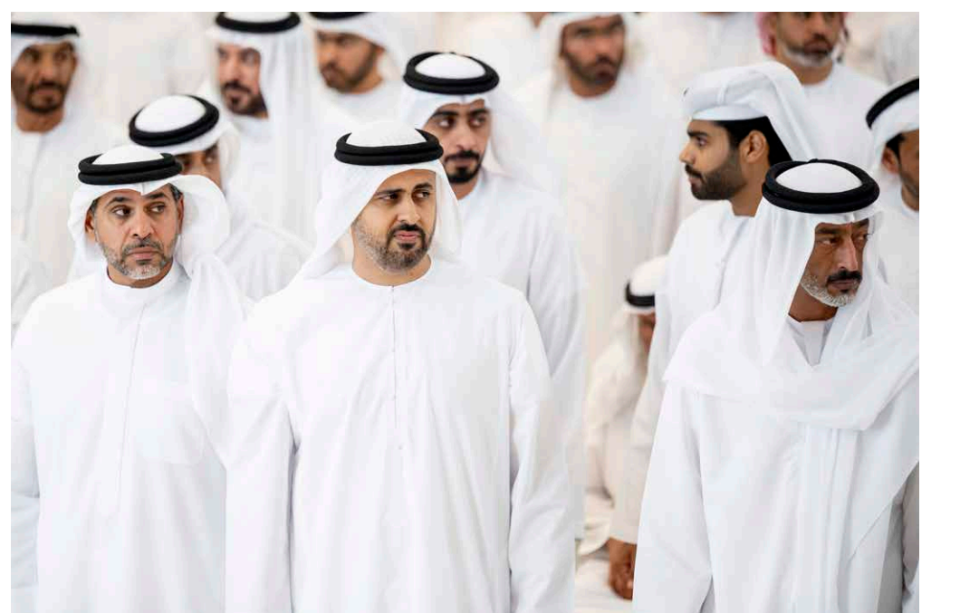
دياب بن محمد بن زايد وسعيد بن حمدان بن محمد وسلطان بن محمد بن خالد