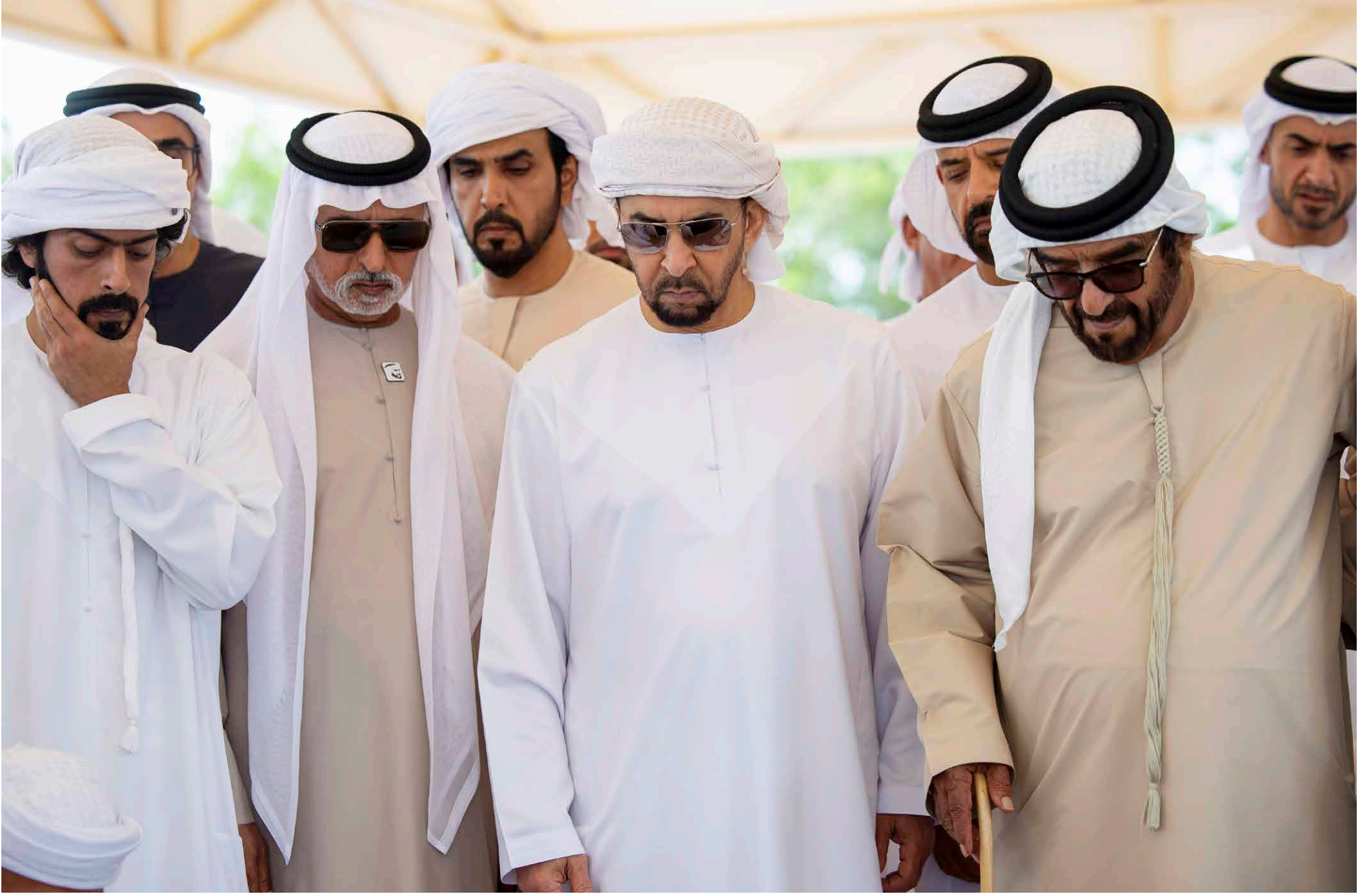
كاد بن محمد بن زايد وحمدان بن زايد وسيف بن محمد ونهيان بن مبارك ومحمد ونهيان بن سيف