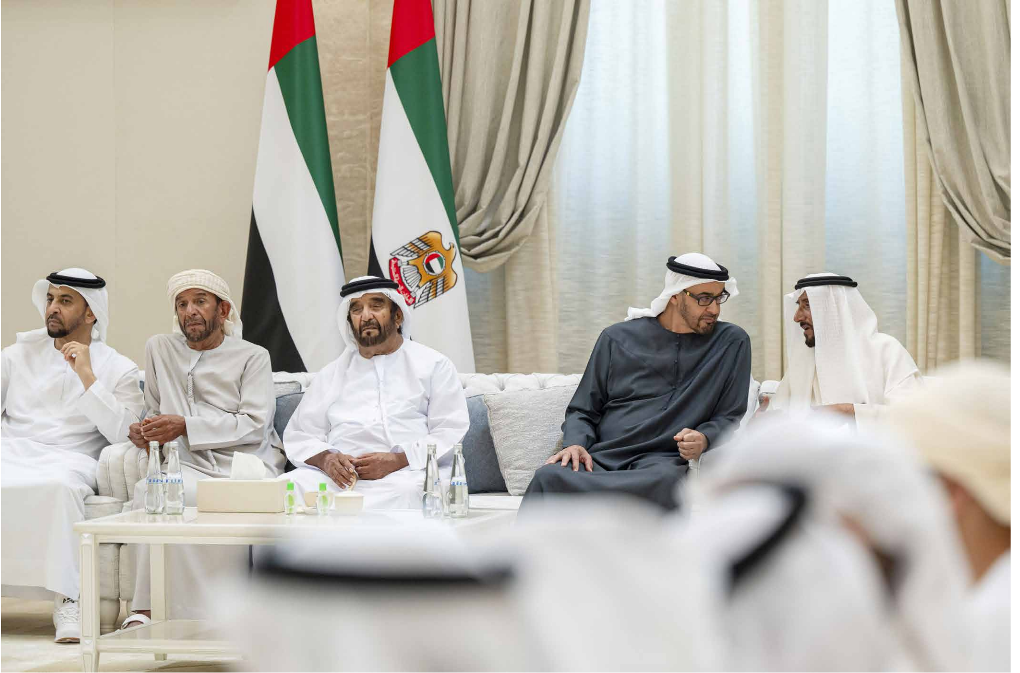
محمد بن زايد خلال تقبله التعاري بحضور حمدان بن زايد وسيف وسرور بن محمد