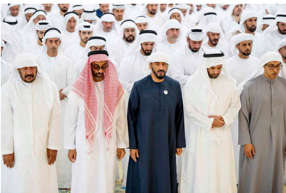
منصور بن زايد ومحمد بن سعود ووطنون ونهيان بن زايد وسعيد بن محمد