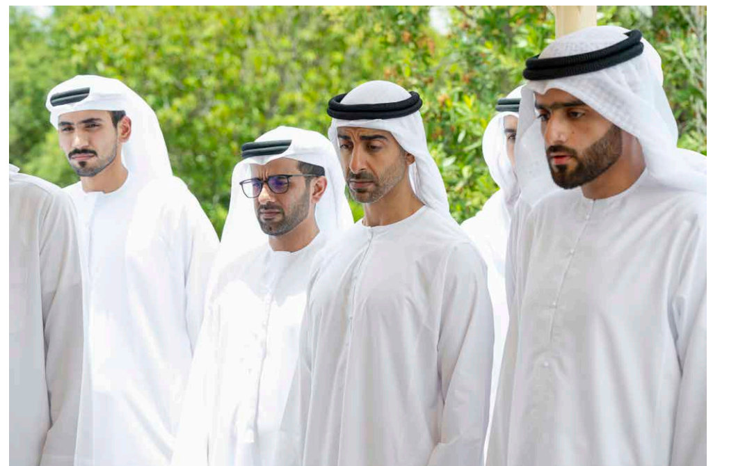
حمدان بن زايد وحمدان بن محمد بن زايد ونهيان بن مبارك ومحمد بن سيف