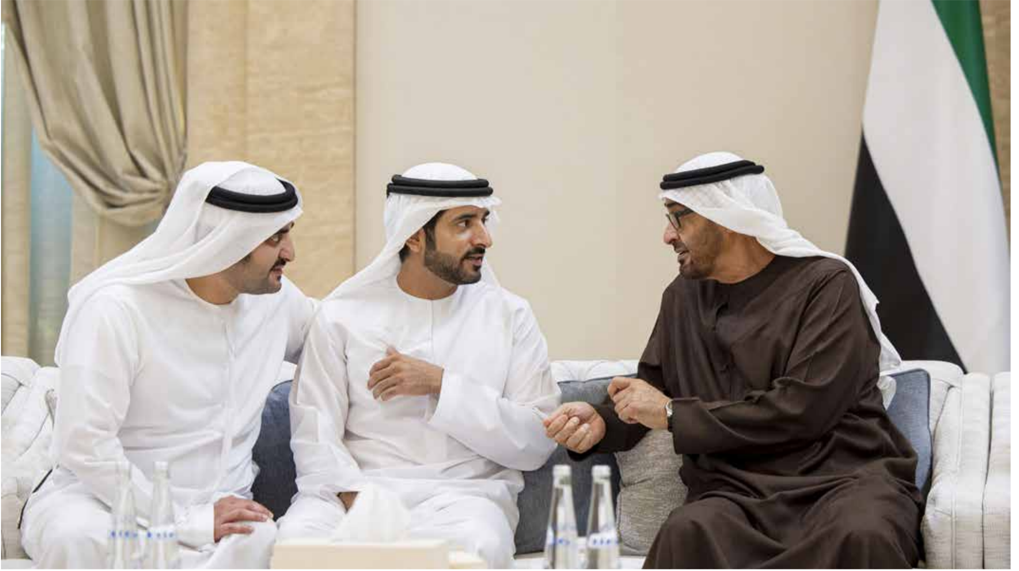
محمد بن زايد خلال تقبله تعازي حمدان ومكثوم بن محمد