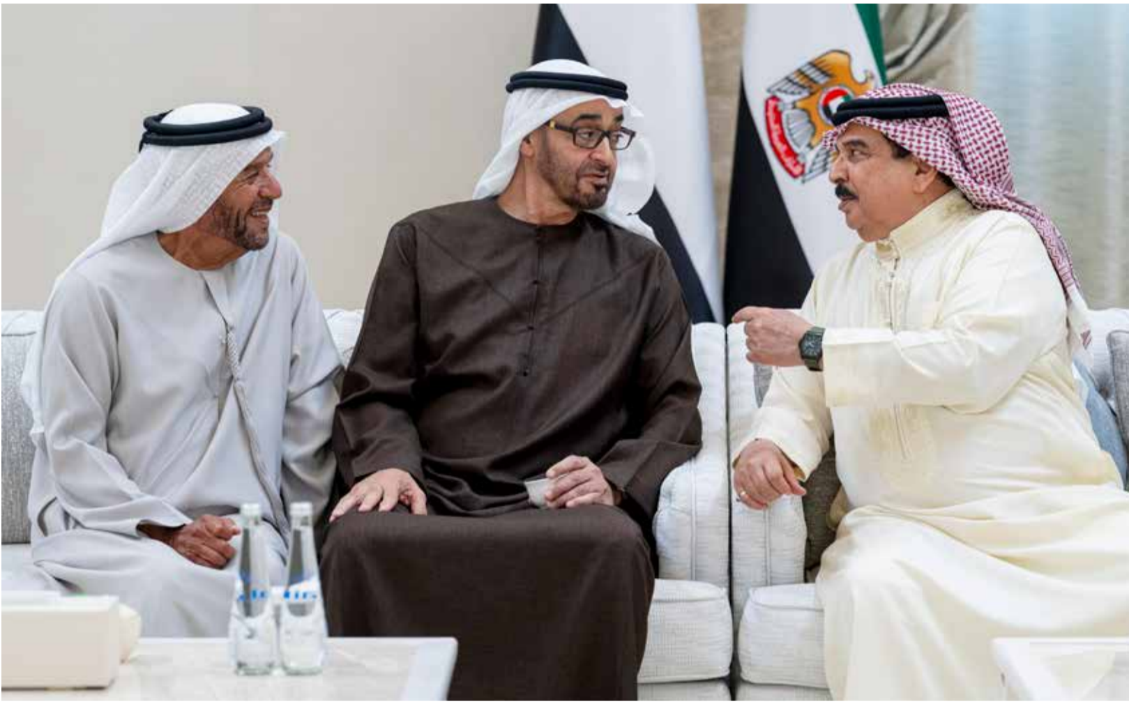
محمد بن زايد خلال تقبله تعازي حمد بن عيسى بحضور سرور بن محمد

المعزون يدعون الهولي تعالى أن يتفقد الفقيد بواسع رحمته ورضوانه وأن يسكنه فسيح جنانه وأن يلهم آله الصبر والسلوان