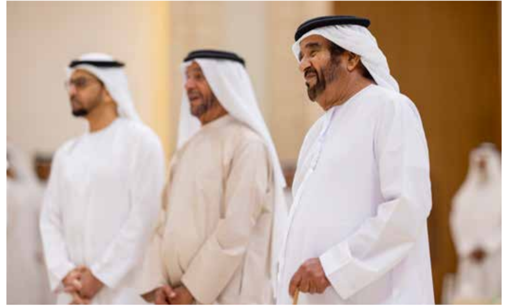
خالد بن محمد بن زايد وحمدان بن زايد وسيف وسرور بن محمد وحماد بن زايد وسلطان بن طحون