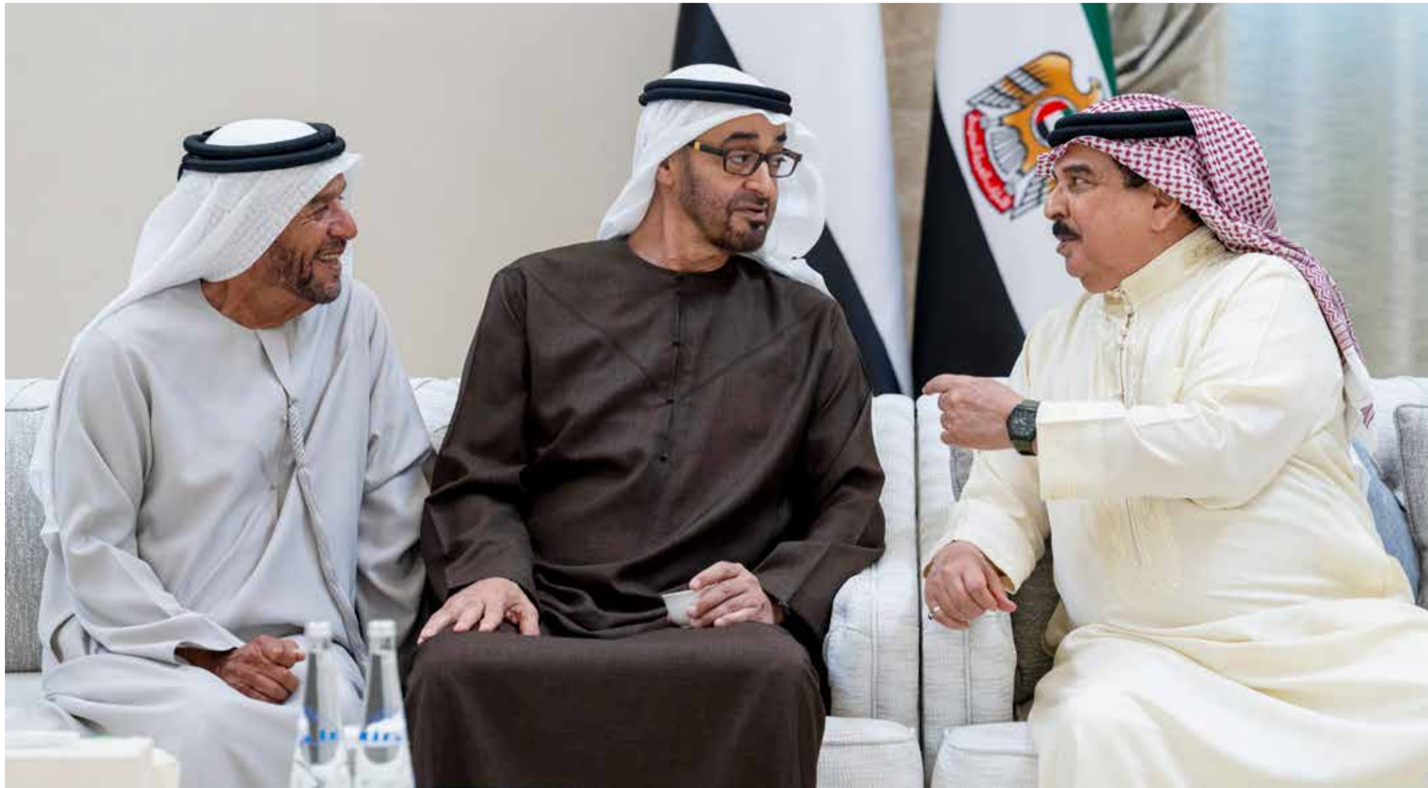
محمد بن زايد خلال تقبله تعازي حمد بن عيسى بحضور سرور بن محمد