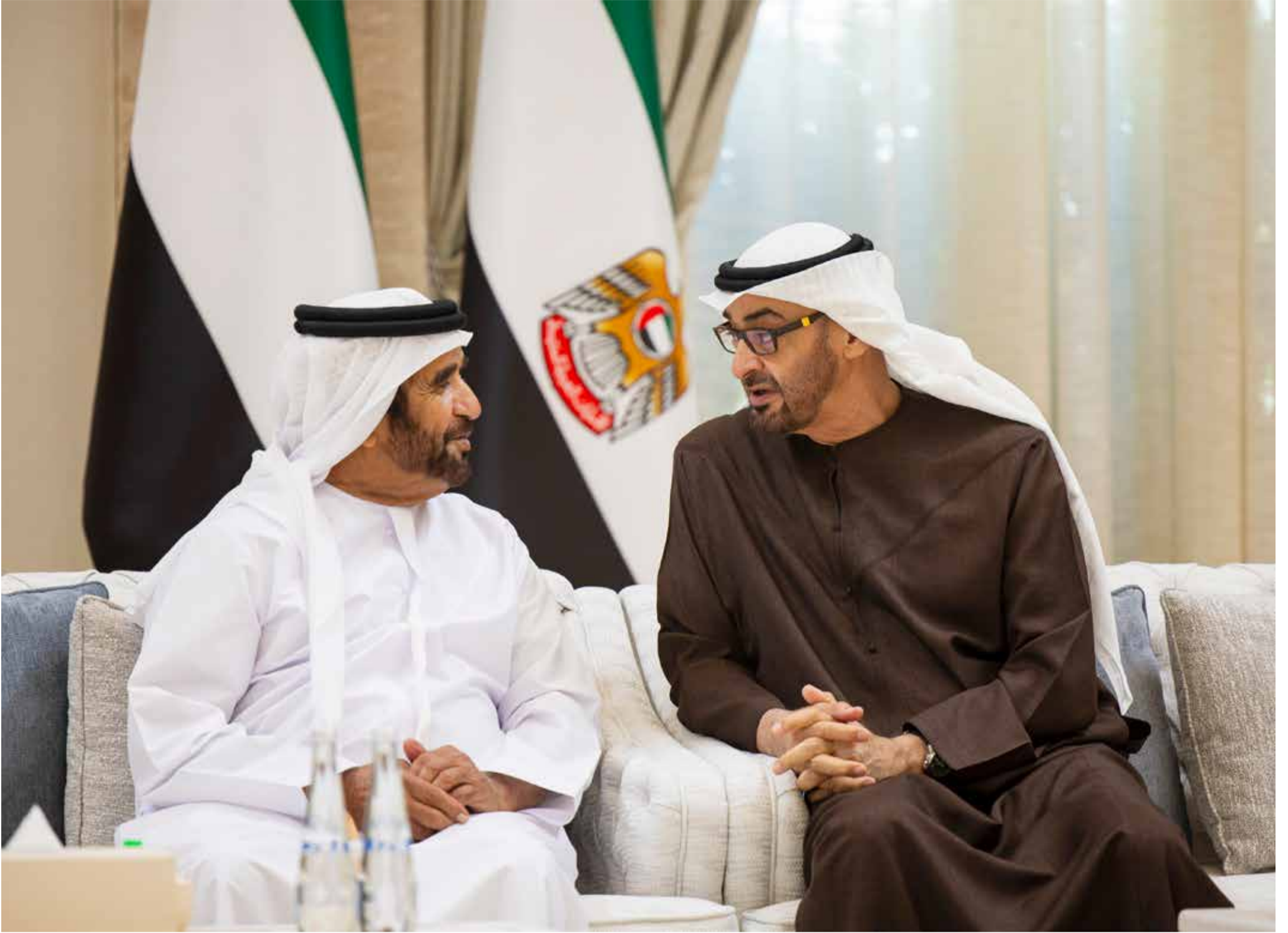
محمد بن زايد وسيف بن محمد