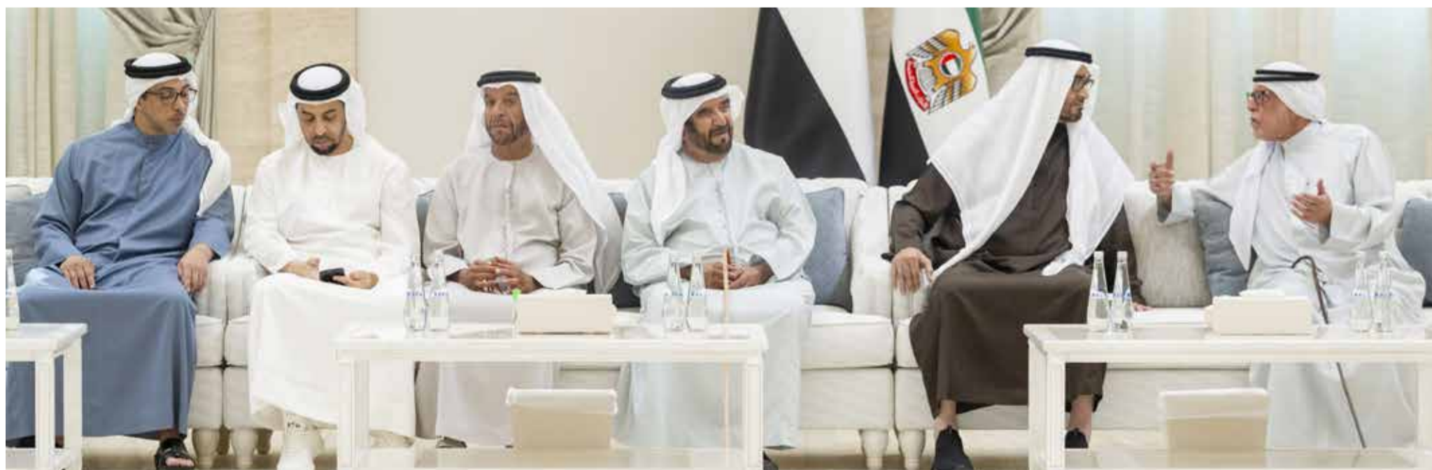
محمد بن زايد خلال تقبله التعازي بحضور منصور وحمدان بن زايد وسيف وسرور بن محمد

تلقى صاحب السمو الشيخ محمد بن زايد آل نهجان رئيس الدولة "حفظه الله" برقية تعزية في وفاة المغفور له الشيخ طحنون بن محمد آل نهجان "رحمه الله" من خادم الحرمين الشريفين الملك سلمان بن عبدالعزيز آل سعود ملك المملكة العربية السعودية أعرب خلالها عن