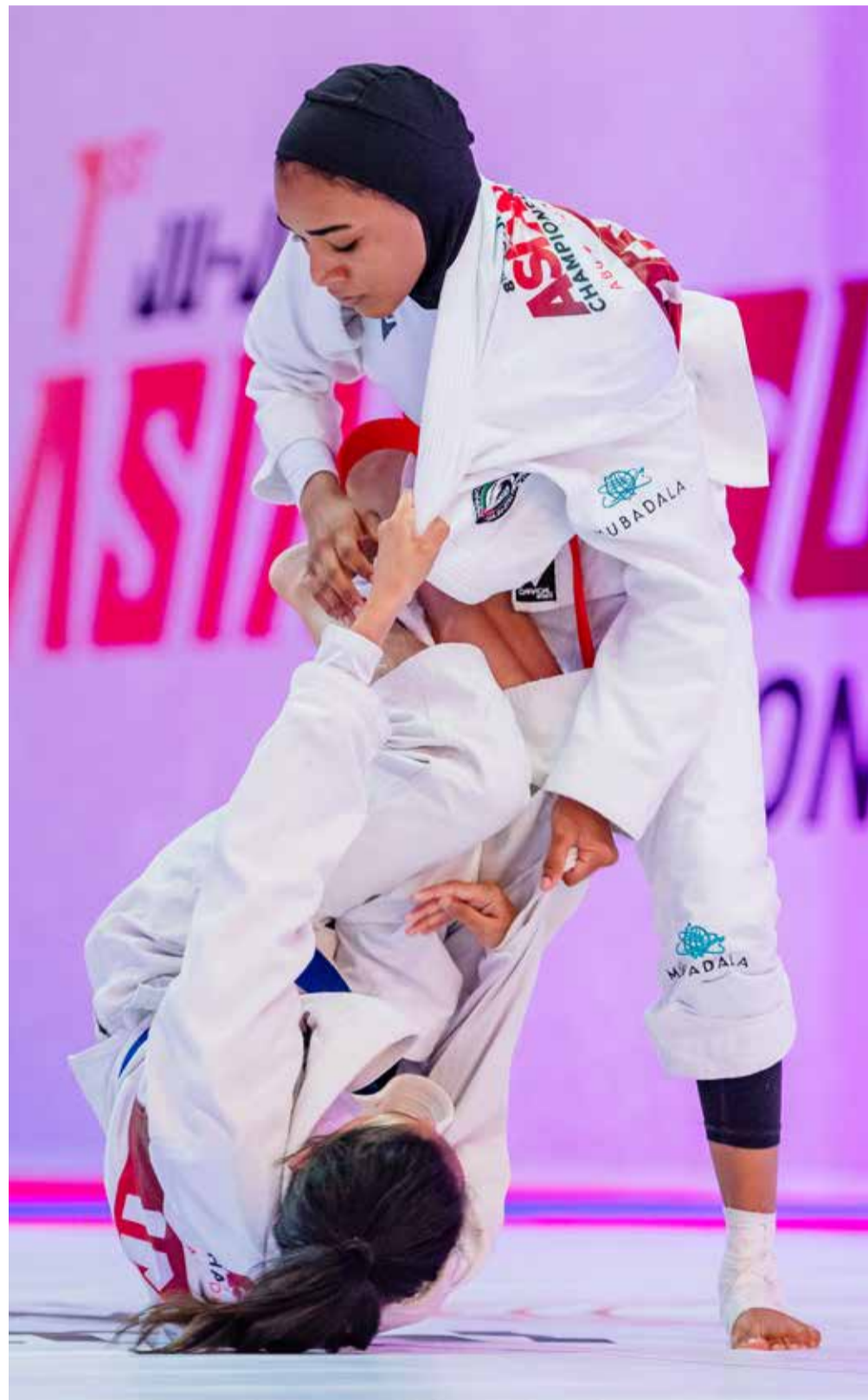
أبوظبي - الوطن

استهل منتخبنا الوطني للجوجيتسو لفئة الكبار مشواره في النسخة الثامنة من بطولة آسيا التي تقام برعاية سمو الشيخ خالد بن محمد بن زايد آل نهيان ولي عهد أبوظبي، رئيس المجلس التنفيذي لإمارة أبوظبي بأفضل انطلاقة، محققاً حصيلة مميزة من الميداليات في منافسات اليوم الأول من البطولة، التي انطلقت أمس في العاصمة أبوظبي.