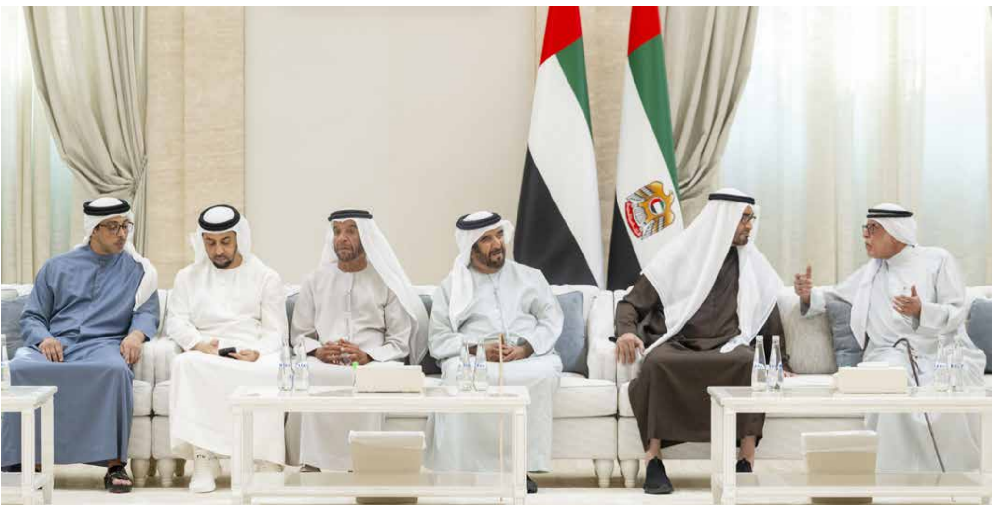
محمد بن زايد خلال تقبله التعازي بحضور منصور وحمدان بن زايد وسيف و سرور بن محمد

كما قدم التعازي إلى صاحب السمو رئيس الدولة .. سمو الشيخ حمدان بن محمد بن راشد آل مكتوم ولي عهد دبي وسمو الشيخ مكتوم بن محمد بن راشد آل مكتوم النائب الأول لحاكم دبي نائب رئيس مجلس الوزراء وزير المالية وسمو الشيخ أحمد بن محمد