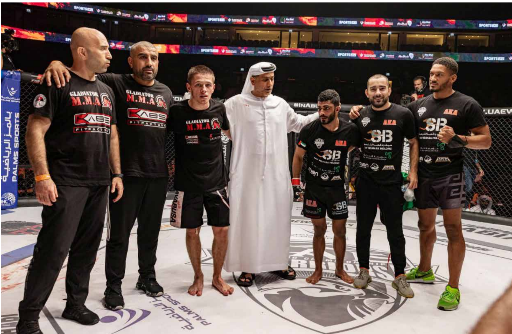
أبو ظبي - الوطن

ستكون المنافسة على أهدأ حينما يتجمع مجموعة كبيرة من أبطال الفنون القتالية المختلفون في النسخة الخمسين (الذهبية) للبطولة الأضخم «محاربي الإمارات» وذلك يوم ١٨ مايو الجاري ويأتي هذا الإعلان المثير في ظل توقعات عالية ومتزايدة بين عشاق البطولة التي ولدت كبيرة ووجدت موطناً قداماً لها بين بقية البطولات في الساحة المحلية والعالمية.