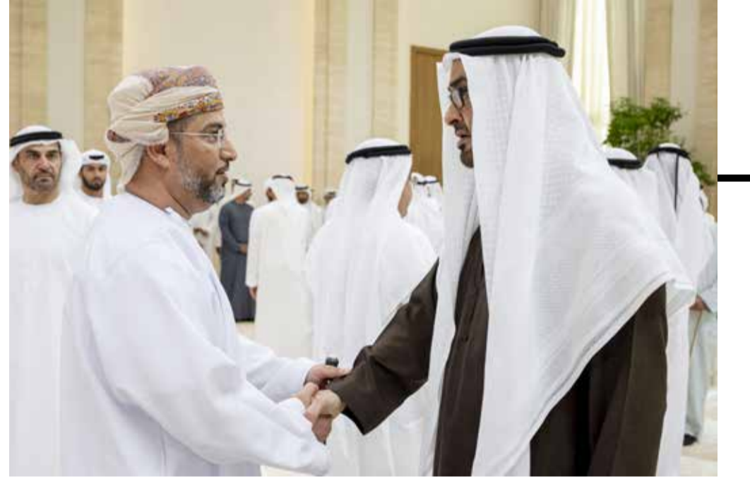
محمد بن زايد طلال تقيله النعاري في وفاة ططون بن محمد