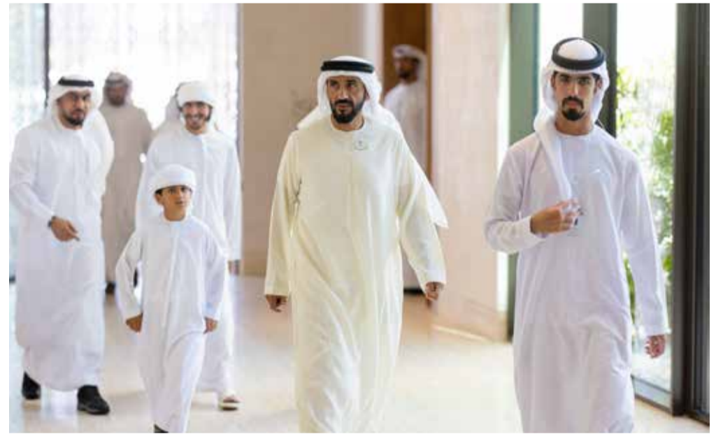
سيف وسرور بن محمد ونهيان بن زايد