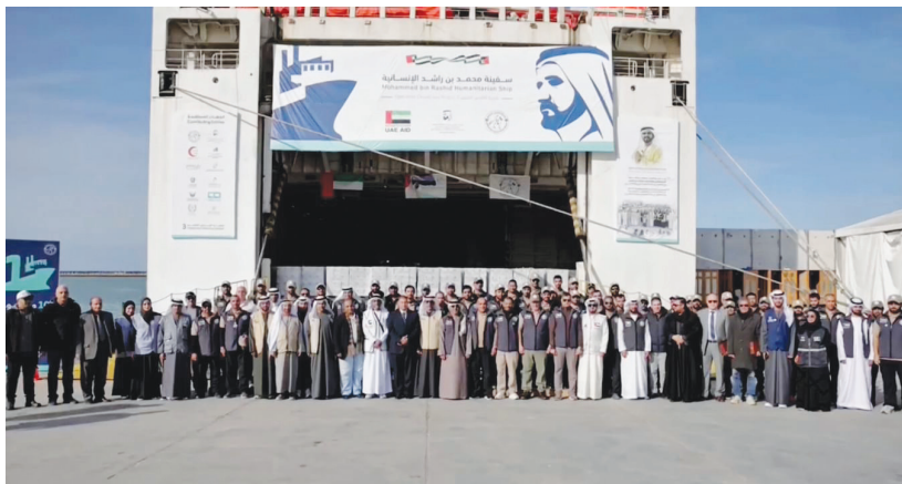
تحميل السفينة على متنها مساعدات متنوعة إجمالي محاولة تتجاوز ٧٣٠٠ طن تشمل مواد غذائية أساسية ومستلزمات إيواء وكسوة شتوية

وتحمل السفينة على متنها مساعدات متنوعة إجمالي محاولة تتجاوز ٧٣٠٠ طن، تشمل مواد غذائية أساسية، ومستلزمات إيواء وكسوة شتوية، إضافة إلى كمّلات غذائية مخصصة للأطفال والنساء، وذلك استجابةً لاحتياجات الإنسانية العاجلة في القطاع.ص»٢