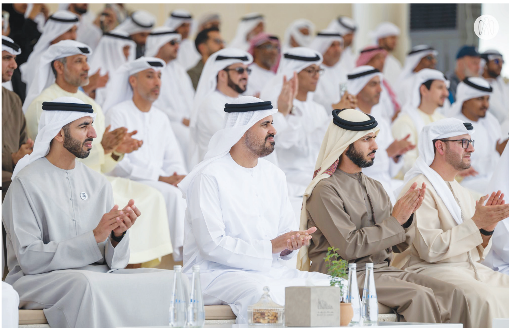
أبوظبي - الوطن

بحضور سمو الشيخ ذياب بن محمد بن زايد آل نهيان، نائب رئيس ديوان الرئاسة للشؤون التنموية وأسر الشهداء، ومعالي الشيخ بن نهيان آل نهيان، وزير دولة، ومعالي الشيخ زايد بن حمد بن حمدان آل نهيان، رئيس الجهاز الوطني لمكافحة المخدرات، ومعالي الوزير الدكتور سلطان بن سيف النيدادي، وزير دولة لشؤون الشباب، كشفت اللجنة المنظمة لألعاب الماسترز أبوظبي ٢٠٢٦ عن الميداليات الرسمية للحدث الرياضي الأبرز في الشرق الأوسط خلال حفل أقيم في واجهة الكرامة في أبوظبي، الموقع الذي يمثل رمزاً وطنياً للحرية والتضحية والوحدة. وجاءت مراسم الكشف عن الميداليات في أجواء احتفالية جمعت عدداً من المسؤولين والرياضيين وأفراد المجتمع، تجسيدا للقيم التي تقوم عليها الألعاب، والمتعلقة في الإصرار والفخر والوحدة المجتمعية. ويأتي هذا الحدث تأكيداً لرؤية دولة الإمارات في تعزيز الروابط الاجتماعية، وترسيخ مفاهيم العافية والحياة الصحية.