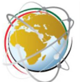
مركز المستقبل للأبحاث والدراسات المتقدمة

فرص العمل للعمال الهنود المهاجرين في روسيا. كما تسعى الهند أيضاً إلى استحواذ شركة التنقيب عن الغاز الحكومية على حصة ٢٠٪ في مشروع «سخالين-١» للطاقة في أقصى شرق روسيا. إضافة إلى ترقية حجم التجارة الثنائية مع روسيا من ٦٧ مليار دولار حالياً إلى ١٠٠ مليار دولار خلال السنوات الخمس المقبلة. ٢- تعزيز التعاون الدفاعي مع روسيا: تعتمد الهند منذ عقود طويلة في تسليحها بدرجة كبيرة على روسيا. وقد عملت الهند على الاستفادة من الزيارة في تعزيز علاقاتها الدفاعية مع موسكو، وفي ظل حاجتها إلى تحديث الأنظمة العسكرية الروسية التي تمتلكها. كما تُعد مبيعات الأسلحة الروسية للهند أحد المجالات الرئيسية للتعاون الدفاعي والعسكري بين الدولتين؛ حيث أبدت الهند اهتمامها بالوصول على الطائرات المقاتلة «سوخوي-٥٧» الروسية الأكثر تطوراً، مقارنة بطائرات «سوخوي-٣٠» التي تشكل غالبية أسراب المقاتلات الهندية. كما تسعى الهند للحصول على المزيد من وحدات نظام الدفاع الجوي «إس-٤٠٠» الروسي، والتي تمتلك الهند ثلاث وحدات منها، ويتوقع استلام وحدتين إضافيتين.