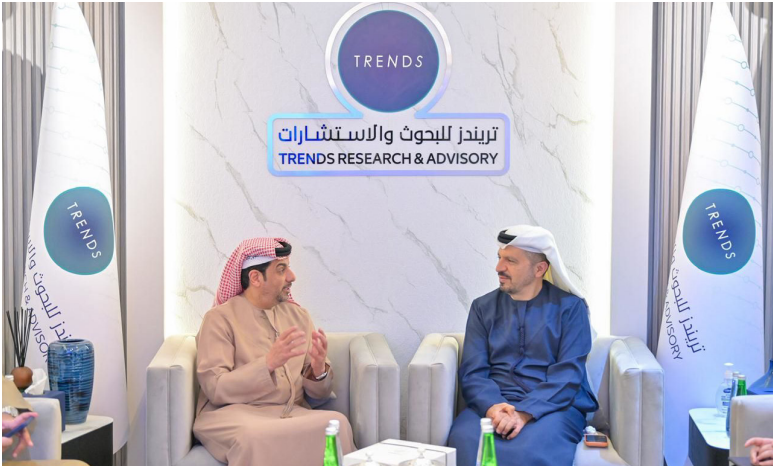
أبوظبي - الوطن

مع المؤسسات الكبرى، لتسخير مخرجاته البحثية وخبراته في تحليل البيانات لدعم جهود الدائرة في بناء مجتمع متماسك وقائم على المعرفة الرقمية المتكبرة. من جانبه، أشاد سعادة الدكتور عارف الحمادي بالمستوى الفني والبحتي الذي وصل إليه المركز، وقال إن تعزيز جودة حياة المجتمع يتطلب رؤية قائمة على البيانات الرصينة والاستشراف الرقمي، لافتاً إلى أن المباحثات مع «تريندز» تهدف إلى تفعيل التكامل بين العمل الميداني الاستراتيجي الذي تقوم به في دائرة تنمية المجتمع وبين الخبرات التحليلية العميقة التي يمتلكها مركز تريندز، مبرحاً عن تطلعه إلى عمل مشترك يساهم في تطوير أدوات الدائرة الاستراتيجية والرقمية بما يخدم تطلعاتها وفق الخطط الحكومية.