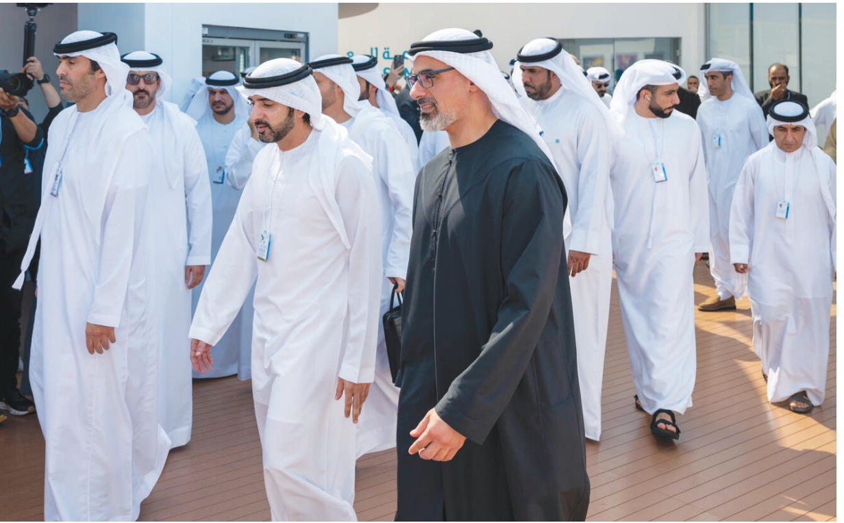
أبوظبي - الوطن:

التقى سمو الشيخ خالد بن محمد بن زايد آل نهيان، ولي عهد أبوظبي رئيس المجلس التنفيذي لإمارة أبوظبي، سمو الشيخ حمدان بن محمد بن راشد آل مكتوم، ولي عهد دبي نائب رئيس مجلس الوزراء وزير الدفاع، رئيس المجلس التنفيذي لإمارة دبي، على هامش أعمال القمة العالمية للحكومات ٢٠٢٦ التي تستضيفها دبي تحت شعار «استشراف حكومات المستقبل». وجرى خلال اللقاء مناقشة عدد من محاور القمة التي تهدف إلى تعزيز منظومة العمل الحكومي من خلال مواصلة تطوير الشراكات الاستراتيجية وتبادل الخبرات والمعارف بين الجهات الحكومية من مختلف أنحاء العالم، بما يسهم في تطوير جاهزيتها لاستشراف المستقبل وتسريع وتيرة تبني الحلول المبتكرة والتقنيات المتقدمة لضمان استدامة الإنجازات التنموية وتعزيز جودة حياة أفراد المجتمع.