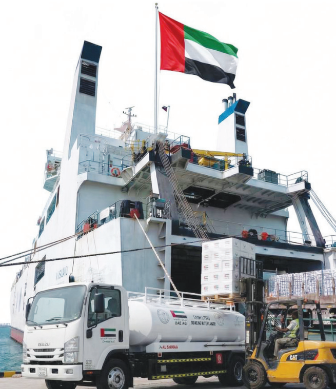
بما يخفف من الأعباء الإنسانية خلال الشهر الفضيل، ويعزز قيم التكافل والتراحم التي تنتهجها دولة الإمارات في مبادراتها الإنسانية.وام

وتتزامن هذه المساعدات مع قرب حلول شهر رمضان المبارك، حيث ستسهم في دعم الأسر المتضررة وتوفير الاحتياجات الغذائية والمعيشية الأساسية،