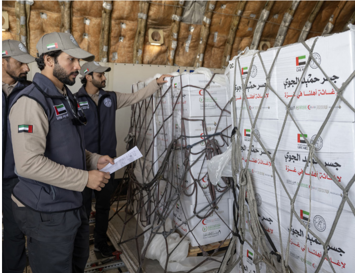
الإمارات ملتزمة بمواصلة إيصال الدعم الإنساني العاجل إلى الأشقاء في القطاع

دعماً لغزة ضمن «الفارس الشهم ٣» وصول آخر طائرات جسر حميد الجوي إلى العريش محملة بـ ١٠٠ طن من المساعدات