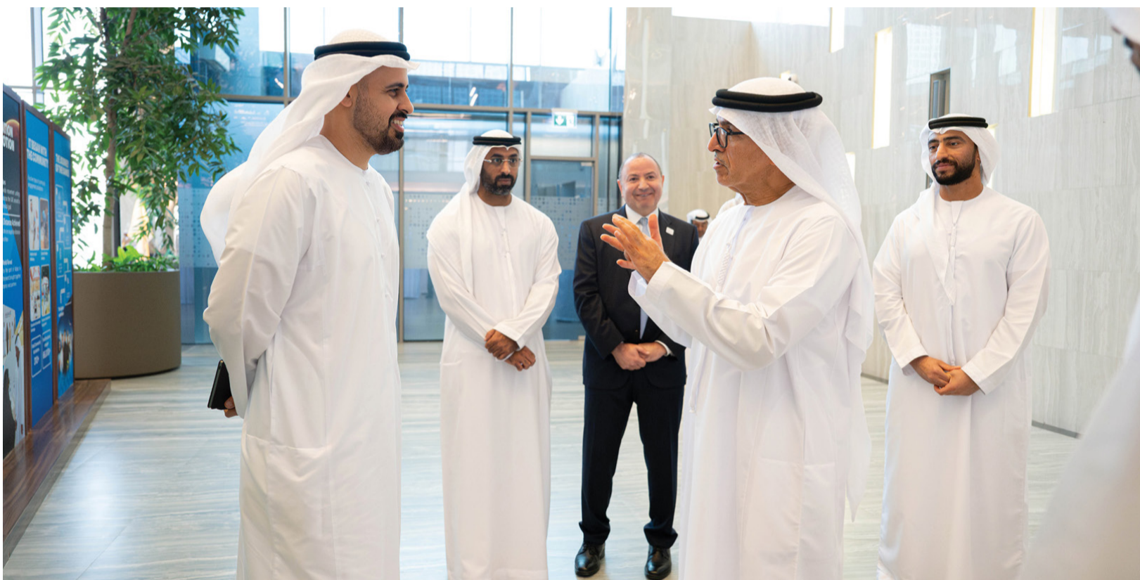
أبو ظبي - الوطن

وجّه سموّ الشيخ ذياب بن محمد بن زايد آل نهيان، نائب رئيس ديوان الرئاسة للشؤون التنموية وأسر الشهداء، رئيس اللجنة العليا المنظمة لألعاب الماسترز أبوظبي ٢٠٢٦، بإقامة «ألعاب الماسترز الإماراتية» سنوياً في أبوظبي، بهدف تعزيز الصحة البدنية واستدامة المشاركة المجتمعية.