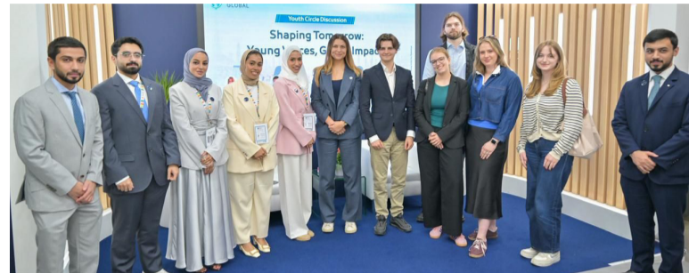
أبوظبي - الوطن

ضمن فعاليات معرض وارسو الدولي للكتاب ٢٠٢٦، نظّم «تريندز جلوبال» بالتعاون مع مجلس شباب تريندز حلقة نقاشية شبابية بعنوان «صناعة الغد.. أصوات شبابية وتأثير عالمي»، وذلك في القاعة الرئيسية لنجاح تريندز رقم TD3، بمشاركة نخبة من الرواد والباحثين الشباب من بولندا و«تريندز».