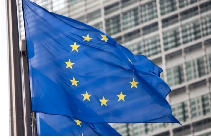
الكهرباء في الاتحاد الأوروبي خلال عام ٢٠٢٥، إذ ساهمت بنسبة ٤٧,٢٪ من إجمالي الإنتاج الكهربائي، مقابل ٢٩,٦٪ للوقود الأحفوري و ٢٣,٢٪ للطاقة النووية. وأم

أظهرت بيانات أولية نشرها مكتب الإحصاء الأوروبي (يوروستات) أن إمدادات الطاقة المتجددة والغاز الطبيعي في الاتحاد الأوروبي ارتفعت خلال عام ٢٠٢٥ مقارنة بعام ٢٠٢٤، في حين واصلت إمدادات الفحم والمنتجات النفطية تراجعها.