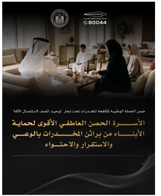
ضمن الحملة الوطنية لمكافحة المخدرات تحت شعار «توحيد الصف لاستئصال الآفة»

وتعد فتنة الشروع في تعاطي المواد المخدرة والإدمان عليها، عرضة لخطر الشروع في تعاطي المواد المخدرة والإدمان عليها، وتشجع مجموعة من العوامل وقوع الأبناء ضحايا لهذه الآفة وأبرزها ضعف المهارات الوالدية وإهمال احتياجات المراهق العاطفية، والتفكك الأسري أو التفكك الخفي بين الزوجين الذي يعد بيئة خصبة لانسحاب الأبناء من رقابة البيت، بالإضافة إلى قلة وضعف المهارات الاجتماعية والحياتية لدى الشباب، مع التأثير الكبير لأصحاب السوء في المجتمع والمدرسة، وغياب ثقافة الحوار داخل المنزل وتحوله إلى قاعات محاكم عائليّة صارمة لا يجد فيها الأبناء الأمان إلا خارج المنزل ما يجعلهم صيداً سهلاً لرفقاء السوء. وتؤكد أبحاث ودراسات دولية أن البيوت القائمة على النزاعات والجفاف العاطفي ترفع خطر انحراف الأبناء نحو التعاطي بنسبة تصل إلى ٥٠٪، مما يجعل التفكك خطراً داهماً يستغله المروجون. وتثبت الدراسات أن تفاصيل بسيطة مثل تناول الوجبات مع الأبناء بانتظام تخفف نسب إقبالهم على السلوكيات الخطرة بمعدل ٣٣٪، بفضل الأمان النفسي الذي تبثه العائلة في وعي الابن. ويشكل وعي الأسرة وحرصها على أبنائها وملاحظتها الدائمة لسلوكياتهم، الحصن الأقوى لحمايتهم من فخ التعاطي، حيث تشير نتائج دراسات عالمية حول الفجوة الإدراكية بين الآباء والأبناء، وأبرزها دراسات المعاهد الوطنية الأمريكية للصحة وأبحاث جامعة ميشيغان، إلى أن ٨٥٪ من الأبناء الذين يقعون في فخ التعاطي، بدأت علاقاتهم بالسلوكيات الخطرة (كالنخدين أو مباحة رفقاء السوء) دون أن يلاحظ الأهل ذلك لمدة تتراوح بين ٦ أشهر إلى سنة كاملة، بسبب غياب الملاحظة المبكرة والتواصل اليومي.