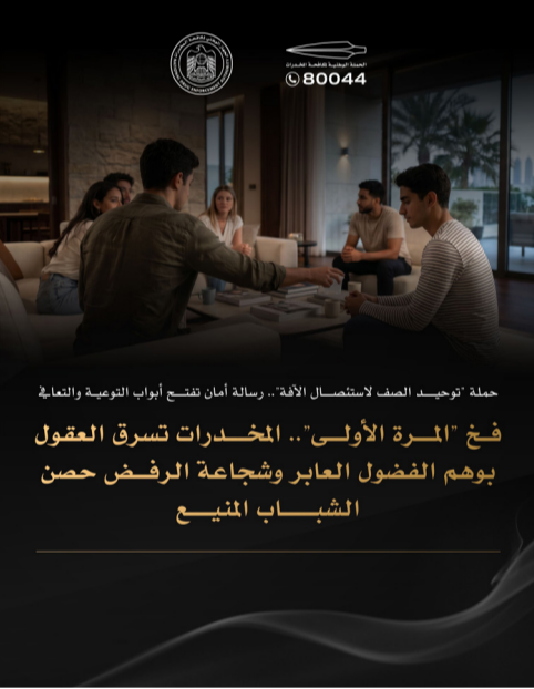
حملة «توحيد الصف لاستئصال الآفة».. رسالة أمان تفتح أبواب التوعية والتعافي

في «المرحلة الأولى».. المخدرات تسرق العقول يومه الفضول العابر وشجاعة الرفض حصن الشباب المتين