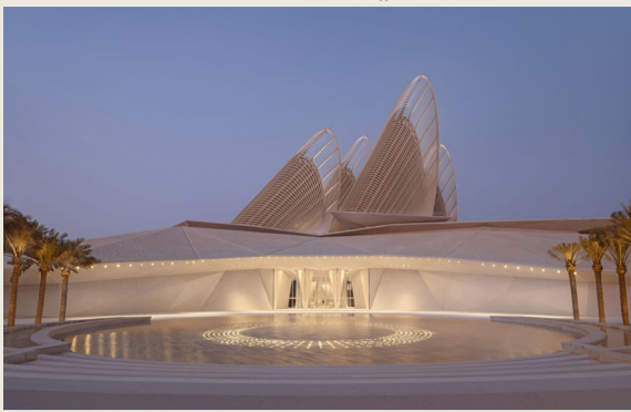
تُنظّم هيئة البحرين للثقافة والآثار، فعالية ثقافية مميزة مساء غدًا بالتعاون مع متحف زايد الوطني، «السبت» بمتحف البحرين الوطني.