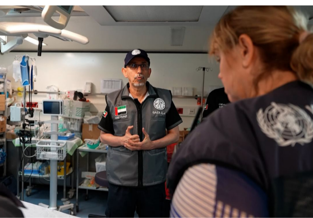
الوفد أطلع على آلية سير العمل والخدمات الطبية والتخصصية المقدمة للمرضى

استقبل المستشفى الميداني الإماراتي في قطاع غزة، وفداً من مكتب الأمم المتحدة لتنسيق الشؤون الإنسانية (OCHA)، في زيارة ميدانية للاطلاع على الخدمات الطبية والعلاجية التي يقدمها المستشفى للمرضى والمصابين، ضمن الجهود الإنسانية الإماراتية المتواصلة لدعم القطاع الصحي في غزة.